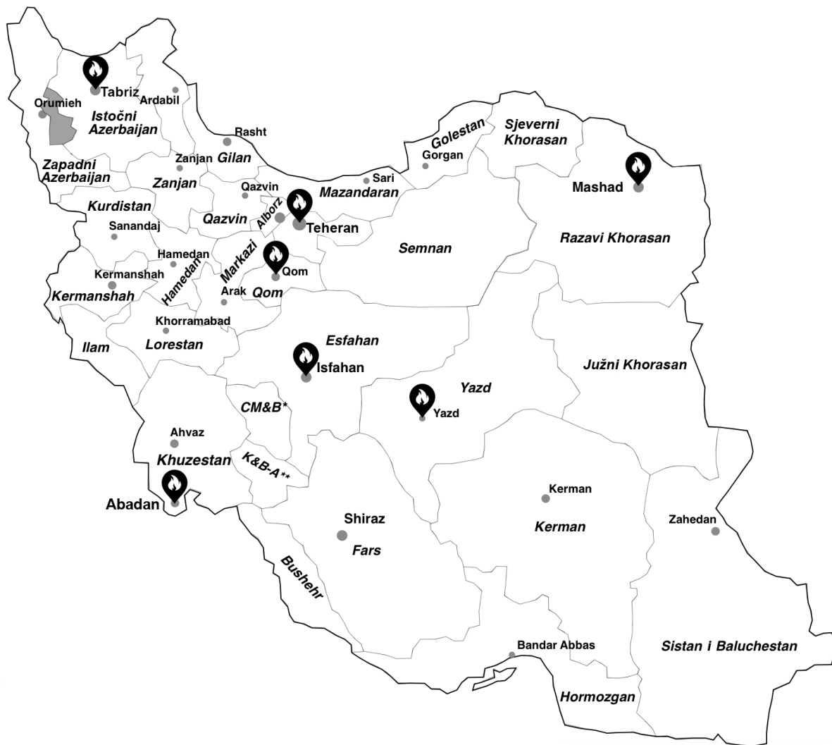
Karta Islamske Republike Iran sa označenim žarištima u toku Islamske revolucije