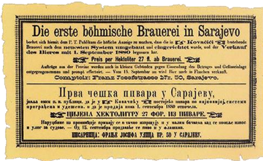
Slika 5 Prvo točenje piva u Sarajevu