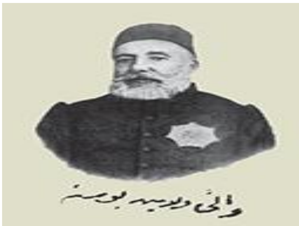
Slika 2 Topal Osman-paša

https://upload.wikimedia.org/wikipedia/commons/7/7a/Topal_Sherif_Osman_Pasha.jpg