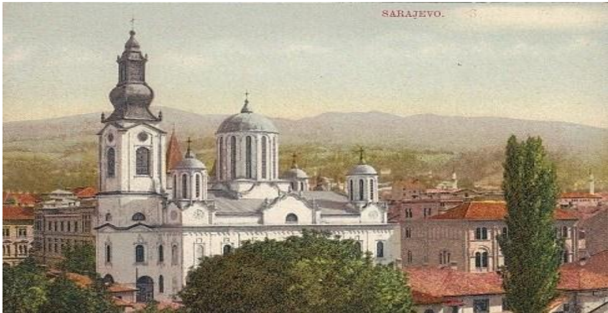
Slika 3 Saborna crkva u Sarajevu

http://srbiubih.com/saborna-crkva-u-sarajevu-u-narodu-poznata-kao-nova-ili-gospodska/?lang=lat