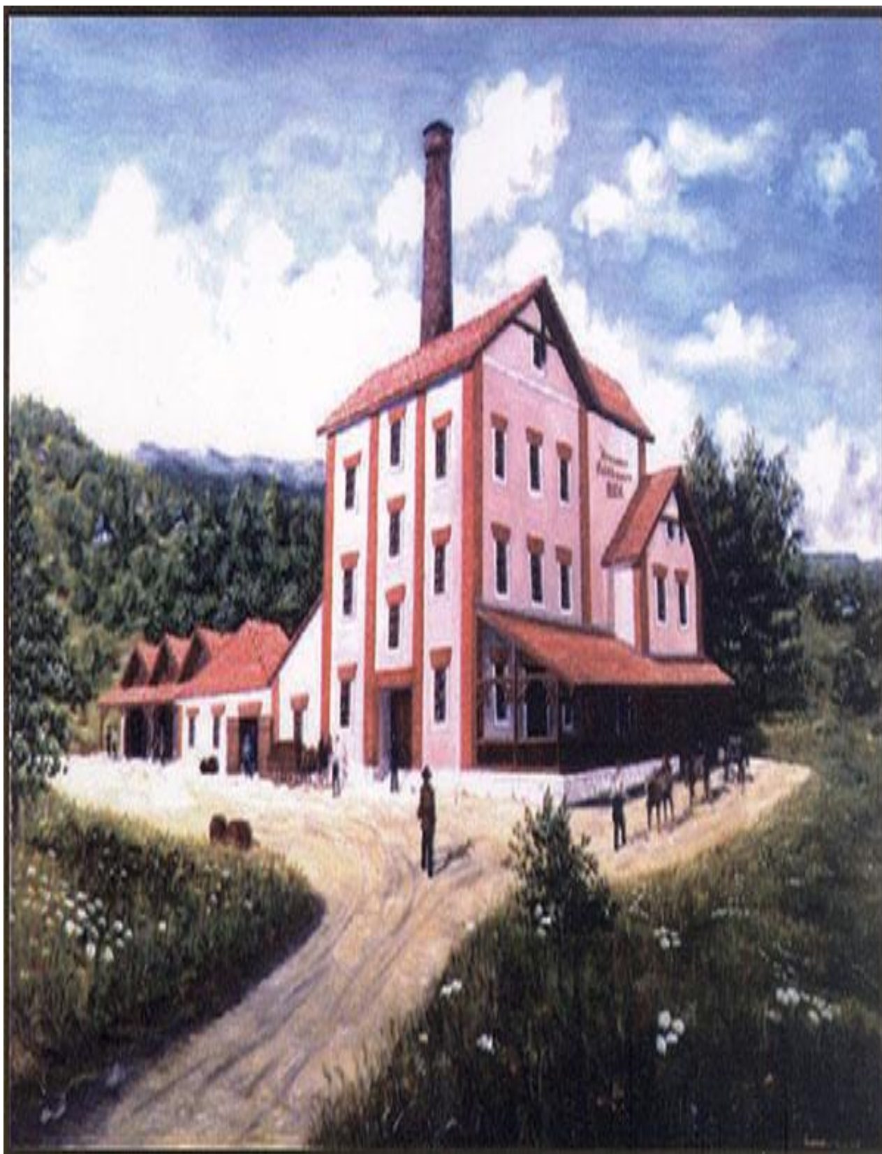
Slika 4 Sarajevska pivara

http://sarajevska-pivara.com/historijat/