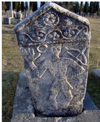
Slika 1. Stećak 8

Stećak, naziv koji se javlja u literaturi tokom 19. stoljeća za sve srednjovjekovne nadgrobne spomenike. Izvorni, ili autentični nazivi tih nadgrobnih spomenika su: zlamen, bilig, kam, mramor, kuća i vječna kuća. Riječ je o nadgrobnim spomenicima koji se kao takvi koriste tokom srednjovjekovne bosanske države (banovine, kraljevine), a pod njima su pokapani svi stanovnici bez obzira kojoj religiozno-konfesionalnoj zajednici pripadali, a poznato je da je Bosna i Hercegovina i tada bila pluralna u religijom smislu. Tu pluralnost činile su tri konfesionalne zajednice, a to su: rimokatolici, krstjani Crkve bosanske i pravoslavci. Neki od ikonografskih motiva koji se pojavljuju na stećcima su: polumjesec, rozeta, mač, ruka sa raširenim prstima (Ibrović, 2018).