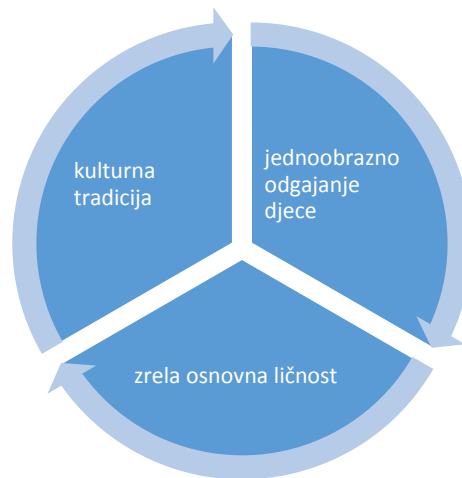
Slika 1. Ciklus kultura – ličnost (Allport, 1969)

Ovdje vidimo da se dijete u početku prilagođava tradiciji, dok u zrelo doba čovjek uspješno spaja tradiciju, kulturu i sliku koju ima o sebi.