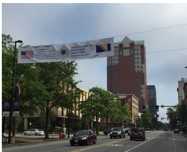
Slika 4. Rezolucija o genocidu 11. jula u Srebrenici Slika 5. Plakat u Manchester-u za 11. juli

O izradi srebreničkog cvijeta bošnjačke zajednice u Manchester-u izvijestili su bh. mediji. 16