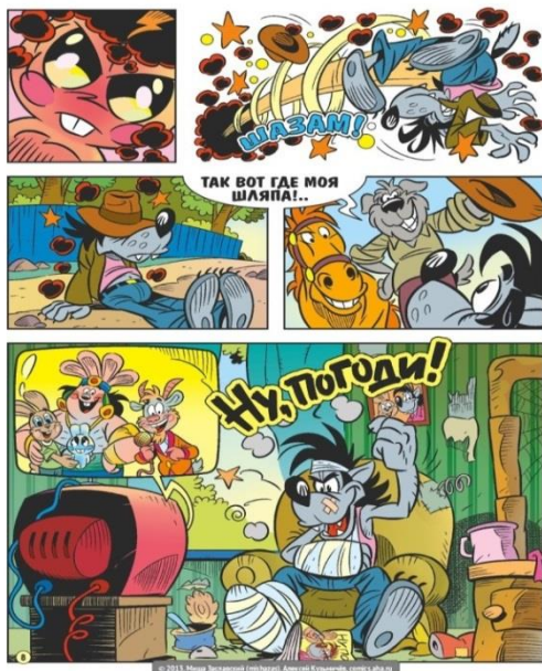
Слика 8. Страница stripа В поисках Хрустального зайца

С обзиром да је јеziчни израз у stripу reduciran и сажет, употребом различитих лексиčkih средстава, стилских фигура и различитих игара ријечи постиже се govorna карактеризација likова, одражавају се њихова дuшевна стања и мисли са што мањим бројем употријебљених ријечи. Различитим поигравањима знаковима остварује се лудичка функција, која има за циљ да читатељима пружи забаву.