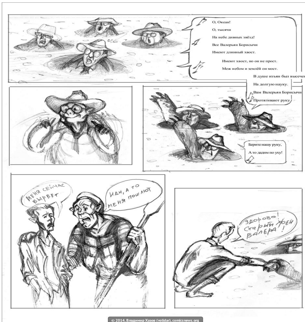
Slika 11. Stranica stripa Сур-Выер

U svim datim primjerima parcelacija je u funkciji isticanja svakog dijela iskaza pojedinačno, svakog segmenta koji je odvojen tačkom. Iako je stripovnom stilu svojstveno da teži što kraćem iskazu, u primjeru (73) parcelacija je doprinijela produžavanju, širenju iskaza.