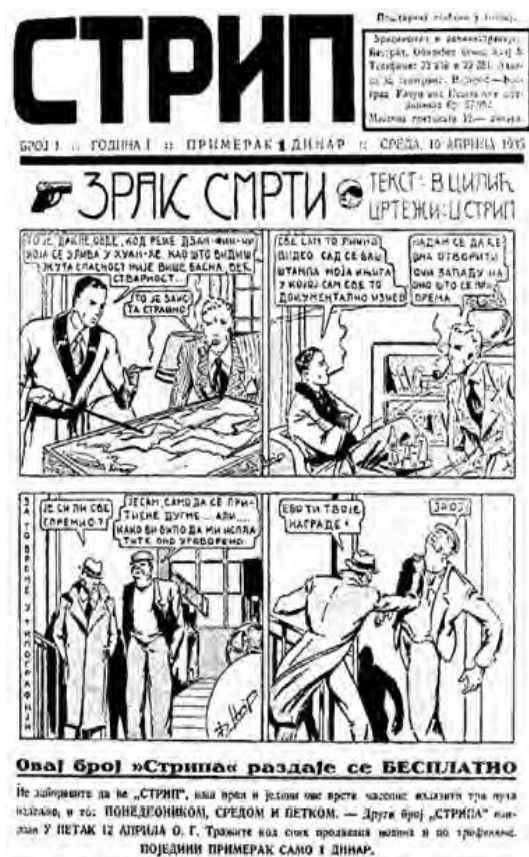
Slika 3. Stranica lista Strip sa stripom Zrak smrti

Lobačov stvara mnoge popularne stripove-adaptacije, kao što su Deca kapetana Granta , Carev glasnik (Žil Vern), Čarobnjak iz Oza (Frank Baum), Pepeljuga u formi stiha, bajke Baš Čelik , Ženidba cara Dušana , Čardak ni na nebu ni na zemlji , bajke Aleksandra Sergejeviča Puškina, ali i autorske stripove: Princeza Ru , Prava pustolovka , Beli duh , Šeikov sin , Gospodar smrti , Zrak smrti i druge. Strip Princeza Ru štampan je u Parizu pod nazivom Princess Thaint . Ovaj strip poznati teoretičar stripa, Pierre Couperie, smatrao je jednim od onih koji je bitno uticao na francuski strip. Nakon Drugog svjetskog rata Lobačov odlazi u Rusiju, ali 60-ih nastavlja saradnju sa Politikinim zabavnikom (Antanasijevič 2015:65-67).