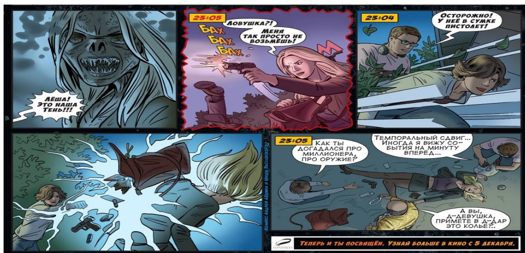
Слика 10. Страница stripа Тёмный мир