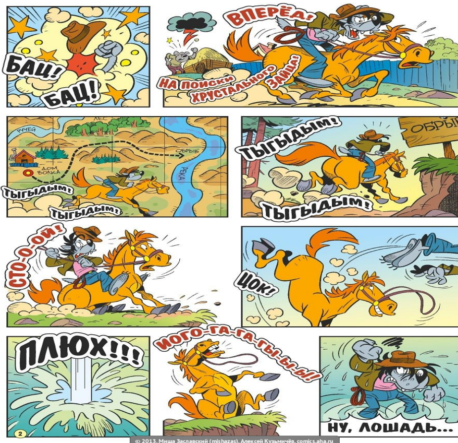
Slika 7. Stranica stripa В поисках Хрустального зайца

U primjeru (1) imamo situaciju gdje su slova poredana od većih ka manjim u jednom oblačiću, a u drugom od većih ka manjim, a sami oblačići postavljeni su u suprotnim stranama. Rusku riječ бац bismo mogli prevesti našom riječju tras , što je česta onomatopeja koja prati događaje tučnjave i udaraca u stripovnom jeziku. Oblačići onomatopeja u ovom primjeru upotpunjuju jednu od čestih slika u stripu, gdje se scena tuče prikazuje oblakom prašine i zvjezdicama i manjim oblačićima koji kruže oko oblaka prašine (slika 7). Ovakav simbol koji se ostvaruje na grafostilemskom nivou zapravo je vizualizacija metafore (Katnić-Bakaršić 2001:193). Uz simboličan crtež, oblik i raspored oblačića sa odgovarajućom onomatopejom omogućavaju nam da što bolje vidimo, osjetimo i doživimo sam događaj sekvence.