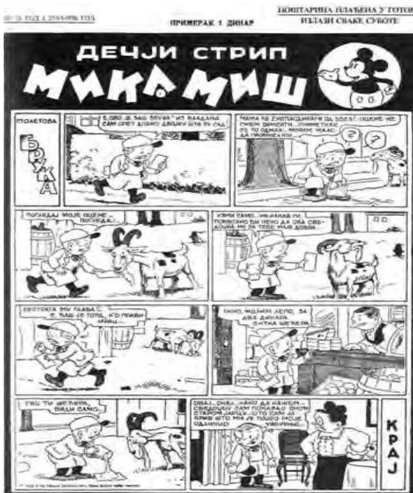
Slika 5. List Mika Miš