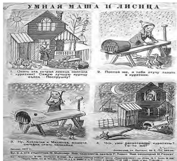
Slika 2. Pametna Maša

1930-ih godina pojavljuju se skečevi Pametna Maša ( Умная Маша ) za koje je pisao Daniil Harms. Vladimir Sutujev, jedan od začetnika sovjetskog crtanog filma, upoznat će sovjetsku publiku sa čuvenim francuskim psićem iz stripa - Pifom. Među časopisima toga vremena ističe se časopis Мурзилка , Веселые картинки , Костёр , Химия и наука , Юный техник . U posljednjem časopisu izlazio je jednostranični strip o avanturama dječaka Petje Rižika i njegovih vjernih prijatelja, psića Mika i Muka (Antanasijević 2015:50-54).