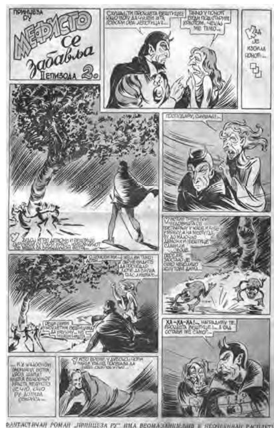
Slika 4. Stranica stripa Princeza Ru

Budući da je razvoj stripovne umjetnosti direktno zavisio od štamparstva, potrebno je spomenuti i Aleksndara Ivkoviča, također ruskog emigranta, vlasnika štamparije Rus i pokretača mnogobrojnih časopisa u kojima su se objavlivali stripovi. Stripovi su se najprije štampali kao dodaci časopisima, a kasnije dodaci prerastaju u specijalne strip-časopise. Jedan od njih je već pomenuti Strip , zatim su uslijedili časopisi Zabavnik , Robinzon , Mika Miš ,