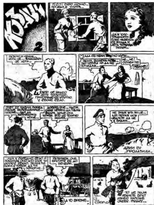
Slika 6. Stranica stripa Kozaci

Ovaj period između dva svjetska rata u pogledu razvoja stripa na našim prostorima okarakterisalo je uzajamno djelovanje domaćih i ruskih autora. Bogato naslijeđe ruskih stvaralaca stripa na jugoslovenskom tlu Rusi će preuzeti, prevesti na ruski jezik i 2017. godine objaviti u zborniku pod nazivom Ruski strip, 1935-1945, Kraljevina Jugoslavija ( Русский комикс, 1935-1945, Королевство Югославия ).