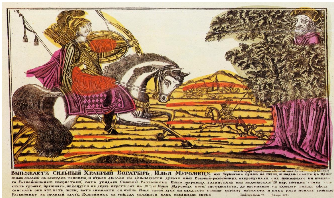
Slika 1. Lubok – Il'ja Muromec i razbojnik Solovjej, 18. vijek

Smatra se da početke stripa, afirmisanog kroz štampu, treba tražiti u 17. vijeku kada su se u sklopu tadašnjih listova objavljivale ilustrirane priče u vertikalnom ili horizontalnom nizu. Pojedine priče imale su humoristični karakter, što nagovještava začetke karikature koja će bitno utjecati na razvoj stripa. Značajan događaj za razvoj formi koje su objedinjavale sliku i tekst imala je pojava litografije, koju je izumio Alojz Zenefelder krajem 18. i početkom 19. vijeka. Litografija je omogućila lakše i kvalitetnije štampanje slika čime je tadašnja štampa postala dostupnija većem broju adresata.