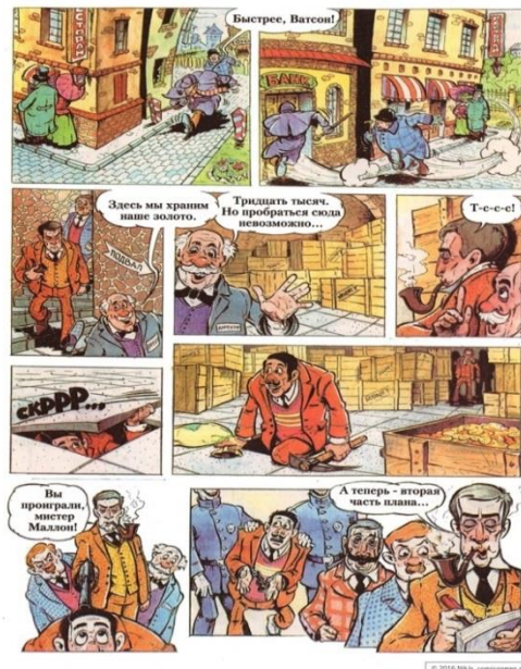
Слика 9. Страница stripа Шерлок Холмс и доктор Ватсон