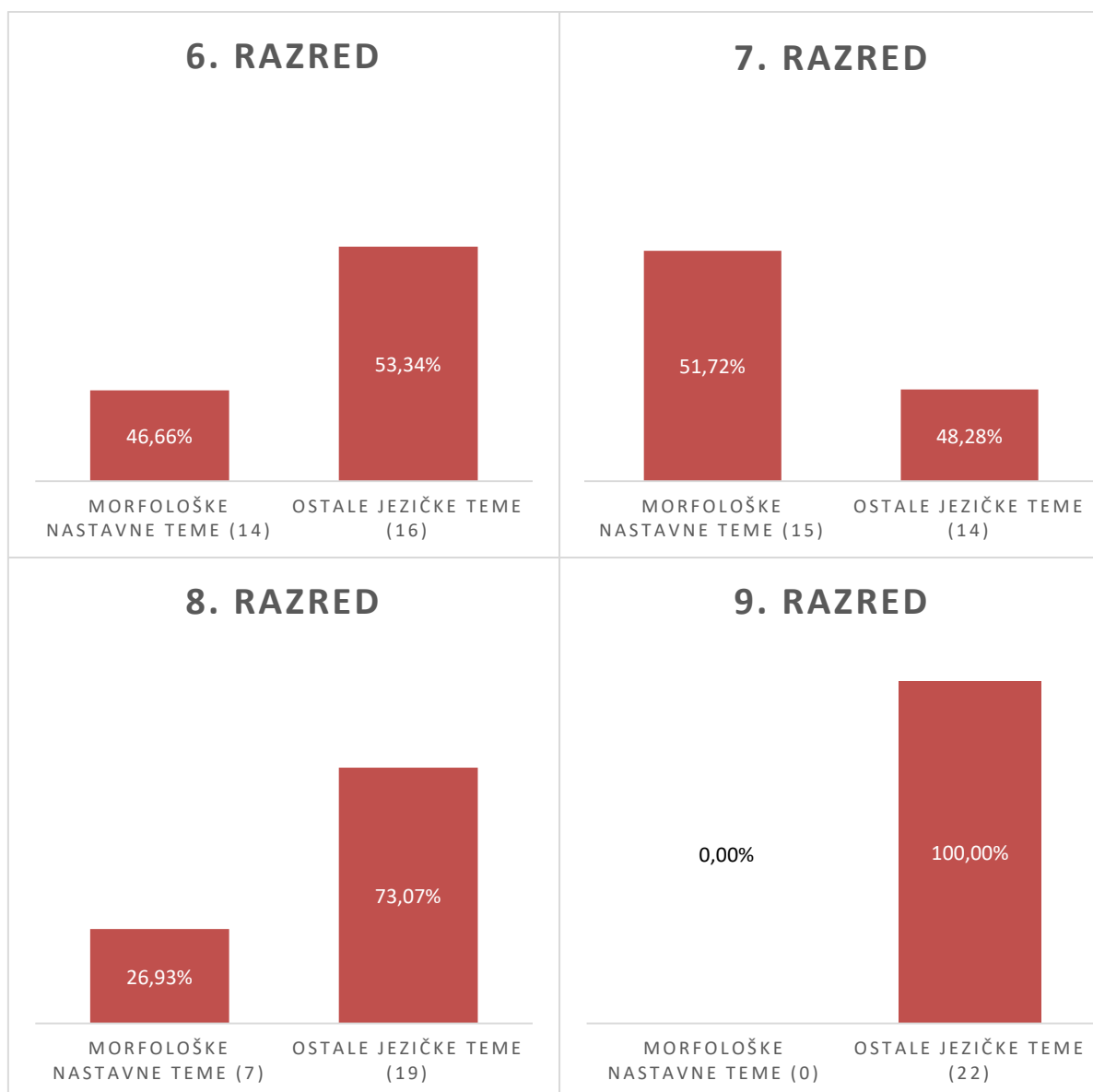
Slika 1. – zastupljenost morfoloških nastavnih tema po razredima

Ako se posmatra Slika 1., koja prikazuje zastupljenost morfoloških nastavnih tema u odnosu na ostale jezičke teme po razredima, primjećuje se kako je najveća zastupljenost morfoloških tema u sedmom razredu, 51,72% (15 tema). Nešto manja zastupljenost je u šestom razredu, 46,66% ili 14 tema, u osmom razredu zastupljenost je 26,93%, odnosno 7 tema, dok morfološke teme u devetom razredu uopće nisu zastupljene. U morfološkim nastavnim temama šestog razreda pretežno su zastupljene imenske riječi (imenice, pridjevi, brojevi i zamjenice) i nepromjenljive vrste riječi (prilozi, prijedlozi, veznici, uzvici i riječce), u sedmom razredu najviše tema je posvećeno glagolima (pomoćni glagoli, glagoli po predmetu radnje, po vidu, glagolski pridjevi i glagolske imenice, infinitiv, prezent, perfekt, aorist, futur,