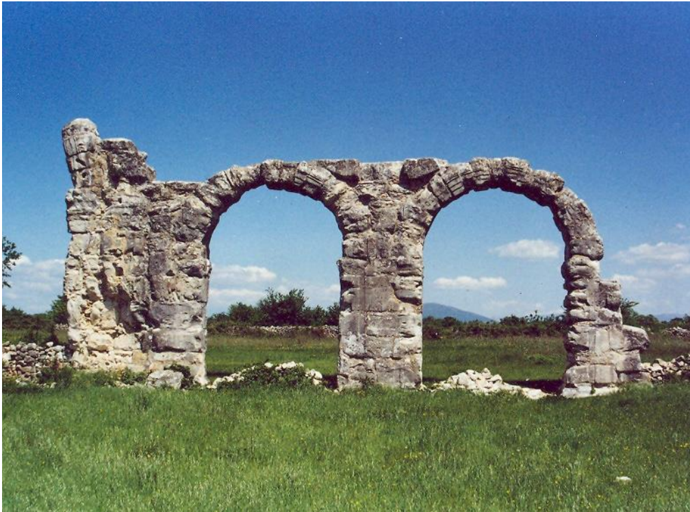
Sačuvani ostatci na lokalitetu Ivoševci kod Knina – lukovi principija logora Burnum