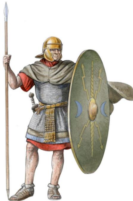
Izgled auksilijarnog vojnika