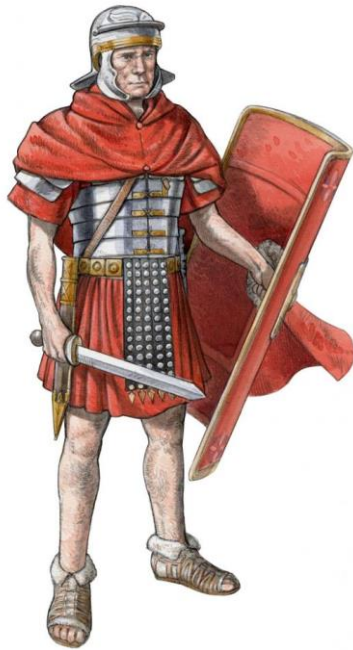
Izgled rimskog legionara