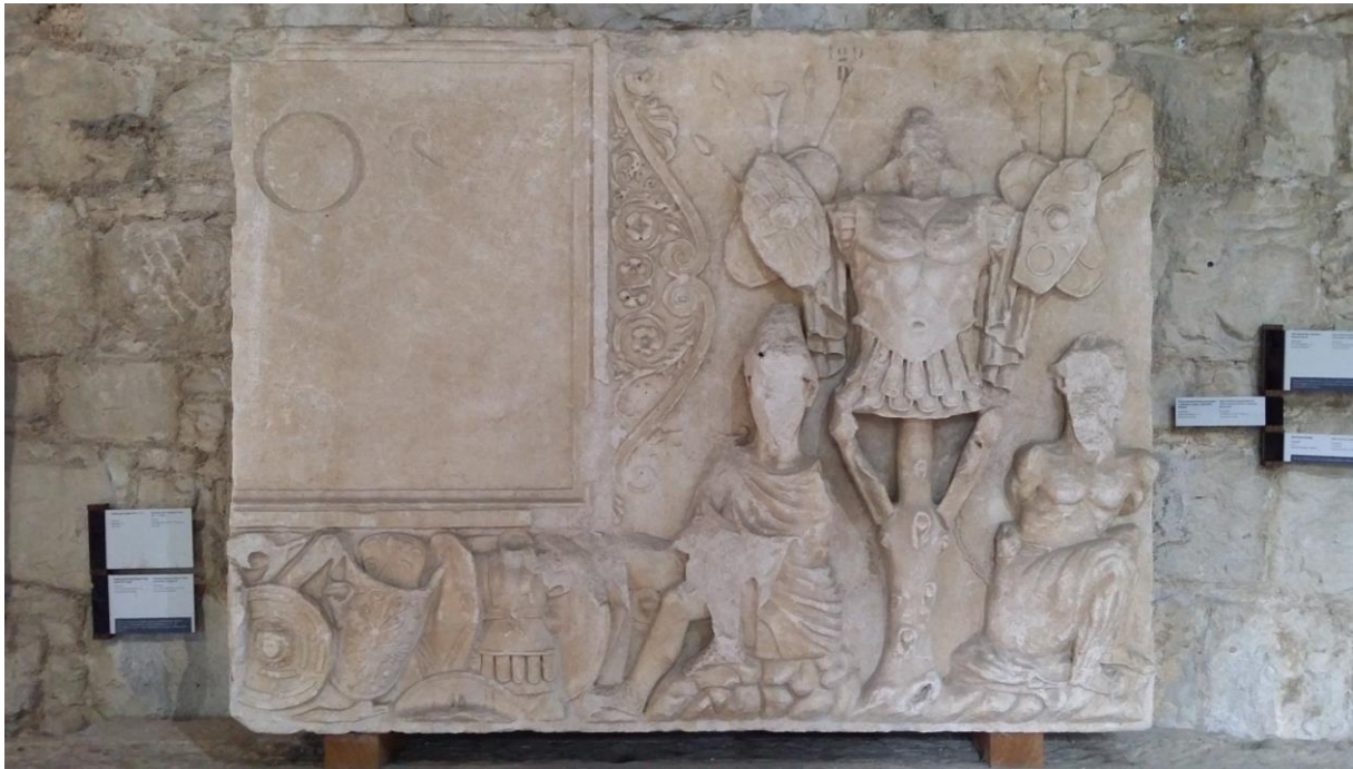
Tropej iz Tilurija