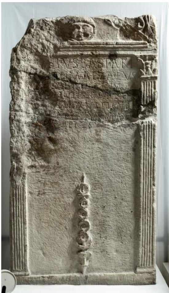
Nadgrobnni spomenik Dasija, Mezeja koji je ostao na službi u matičnoj provinciji