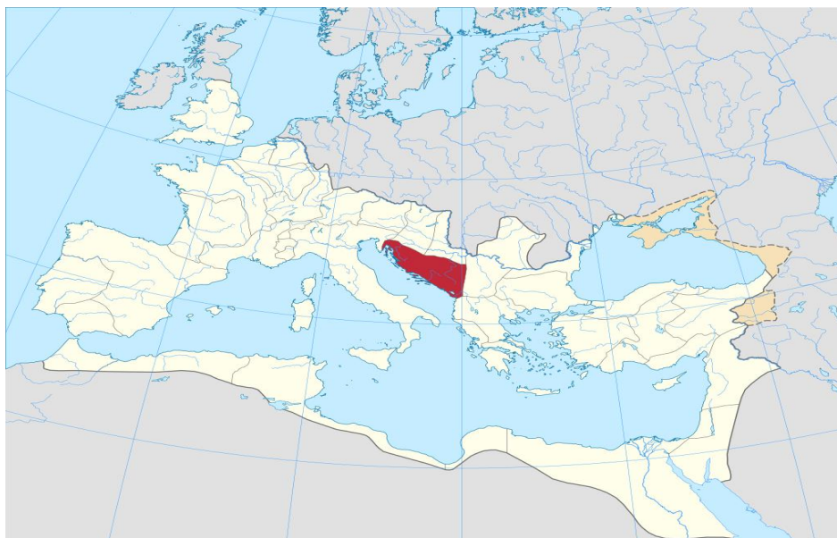
Položaj provincije Dalmacije unutar Rimskog Carstva