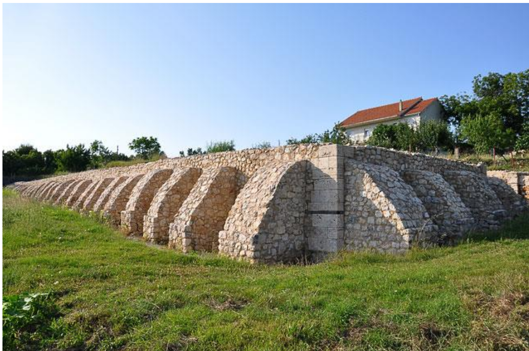
Ostatci logora Tilurium na lokalitetu Gardun kod Trilja (Preuzeto s: https://www.hkv.hr/images/stories/Slike05/tilurium/5-tilur.jpg 26. VII. 2022.)