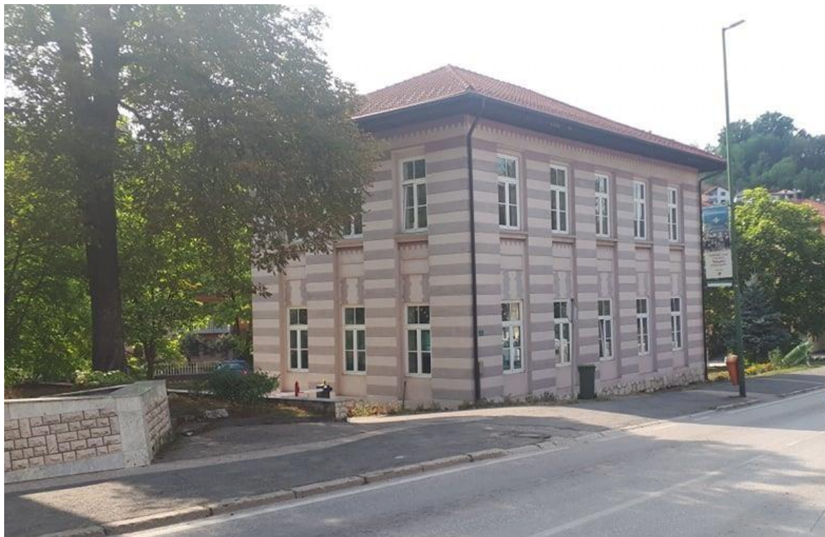
Sl. 2. Zgrada Šarenog mekteba

U Šarenom mektebu ostaje sve do 1993. godine, kada biva iseljena, jer je zgrada vraćena u vlasništvo IVZ-a Tešanj. Tada, biva smještena u Vemalov salon namještaja u stambenom naselju Simetrane, gdje ostaje sve do 1998. godine, kada se premješta u nešto adekvatniji prostor, zgradu Dječijeg obdaništa. Tokom 2005. godine Fondacija za održiv razvoj Odraz ulaže značajna sredstva za proširenje i adaptaciju prostora, te tako Biblioteka otvaranjem čitaonice dobija prostor od 272 m 2 . Nakon skoro sedam decenija došlo je vrijeme da se počne nešto konkretno raditi i na planu izgradnje nove zgrade i konačnog smještaja. Stoga je odluka o trajnom smještaju ove izuzetno važne kulturne ustanove grada, pretočena u strateški razvojni projekt. 34