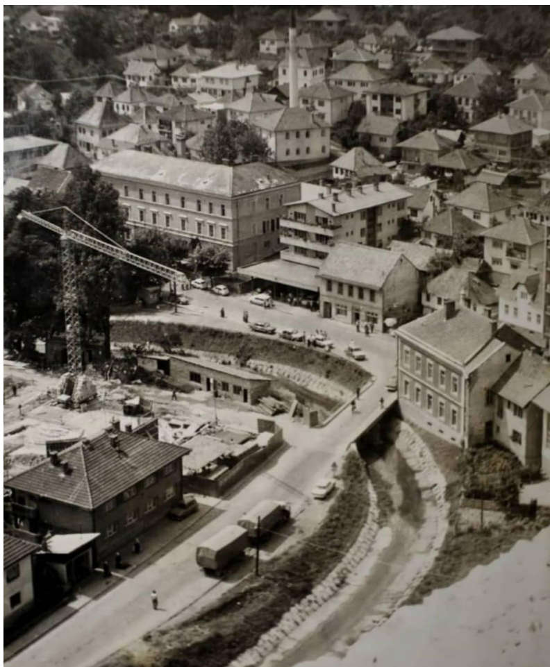
Sl. 8. Izgradnja Doma kulture u Tešnju 1979. godine 52