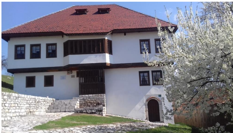
Sl. 5. Eminagića konak

Cilj Muzeja je da se zadovolje potrebe korisnika i da ova baštinska institucija postane što vidljivija u lokalnoj zajednici, pa i šire, kako bi se ukazalo na važnost postojanja i djelovanje jedne ovakve institucije. Formiranje ove specijalne biblioteke zahtijevalo je i izmjenu sistematizacije radnih mjesta, tako da je za ovo radno mjesto uvršten stručni profil MA bibliotekarstva i informacijskih nauka. Na ovu problematiku ukazala je kolegica Medina Garić, studentica na diplomskom/MA studiju komparativne književnosti i bibliotekarstva, kroz svoj rad u okviru predmeta Upravljanje informacijskim institucijama. 44