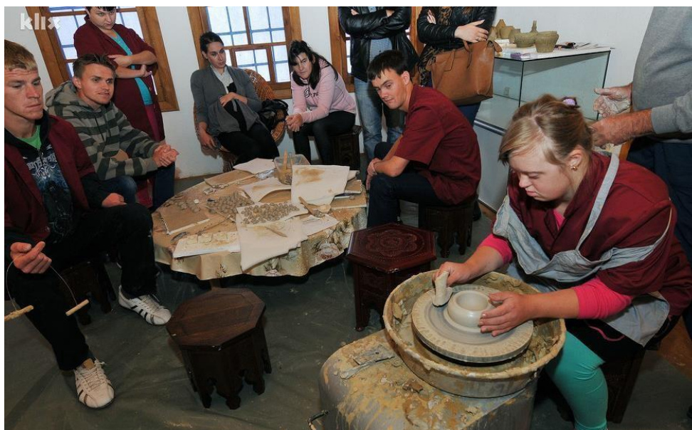
Sl. 10. Priprema posuda na grnčarskom kolu 145

Primijetna je pojava povećane zainteresovanosti obrazovnih struktura za aktivnije sudjelovanje u projektima koje organiziraju baštinske ustanove, odnosno za uključivanjem baštinskih ustanova kao sastavnog dijela modernog obrazovnog procesa. JU Centar za kulturu i obrazovanje Tešanj daje veliki značaj promociji književnosti, posebno je značajna podrška mladim autorima, a u ovoj ustanovi održan je veliki broj okruglih stolova. Tešanjaska biblioteka posjeduje najbolje uslove za održavanje edukativnih radionica: multimedijalnu salu i salu za promocije, te čitaonice. Ovi novi sadržaji razbijaju percepcije o baštinskim ustanovama, kao o mjestima gdje se dolazi potrošiti vrijeme i novac. Takva razmišljanja su anahrona i štetna. 144