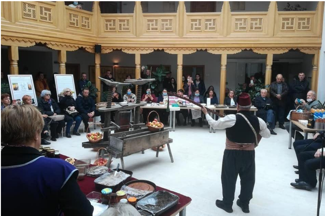
Sl. 9. Tešanjaski dani pekmeza

Posljednjih godina primijetan je porast turista koji dolaze na jednodnevne posjete, posebno je velik broj turista koji dolaze iz Hrvatske, Slovenije, Srbije i ostalih dijelova Bosne i Hercegovine. Nažalost, usljed pandemije COVID 19, broj turista je prepolovljen, a baštinske ustanove su znatno reducirale svoje aktivnosti. Prilikom posjeta turisti su uvijek pokazivali veliku zainteresovanost za proizvode domaće radinosti i lokalnu gastronomiju, koji predstavljaju tipičan narodni folklor: ćilimi, serdžade, peširi, bošče, grnčarske proizvode, tešanjaska tagarica i pekmez.