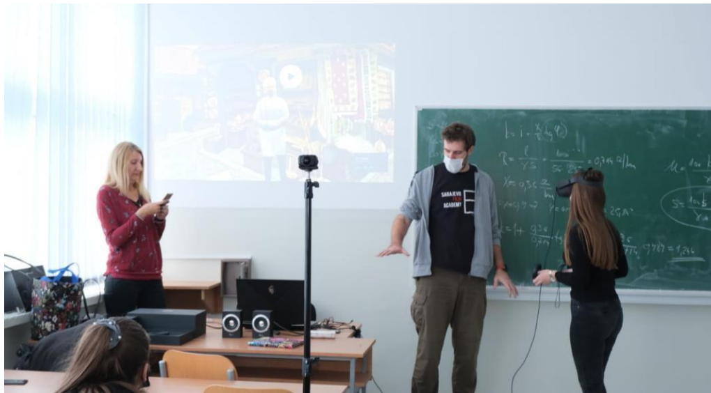
Sl. 11. Detalj s radionice Virtuelni muzej starih zanata u JU Tehničkoj školi Tešanj