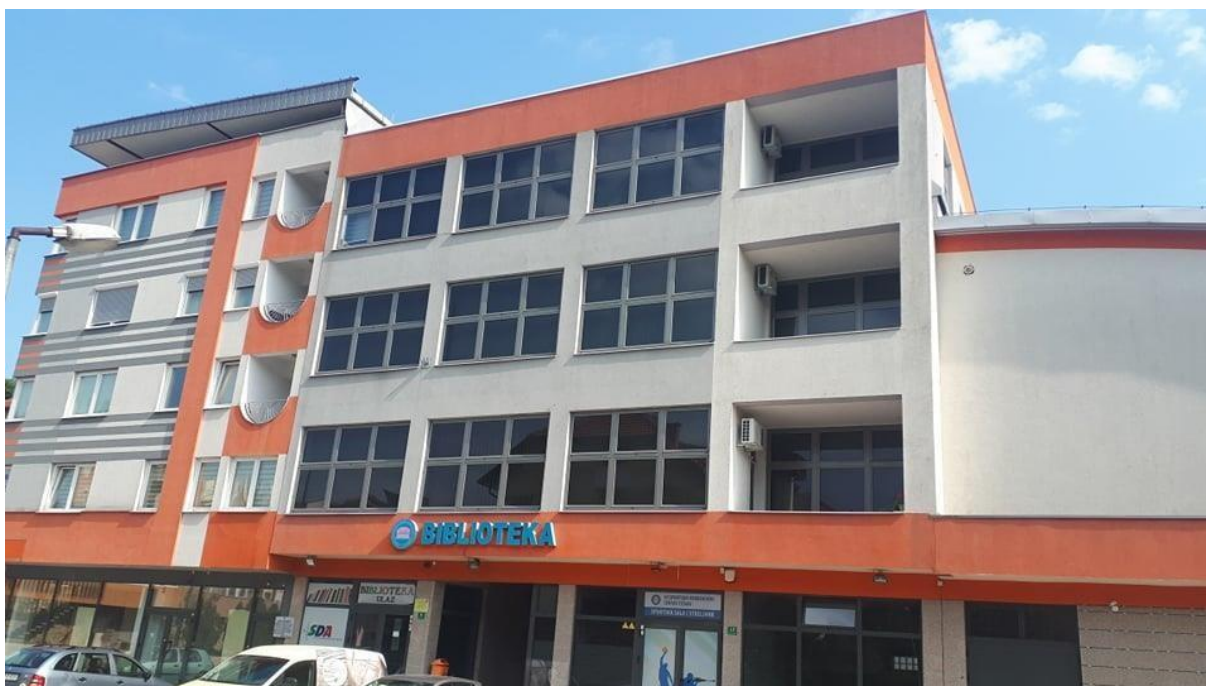
Sl. 3. Novoizgrađena zgrada tešanjске biblioteke

Biblioteka Tešanj je svoj 70-ti rođendan dočekala u punom sjaju, savremena, progresivna u ostvarivanju svoje misije i vizije. U nastojanju da svoj fond i dalje bogati, Biblioteka izdvaja sredstva za kupovinu knjiga, te se u njoj mogu naći najnoviji naslovi i izdanja. Tako da danas, cjelokupni fond sadrži oko 70 000 knjiga, preko 30 000-40 000 bibliotečkih jedinica, periodičnih publikacija i druge bibliotečke građe. Nova zgrada i obogaćen knjižni fond, doprinjeli su da je u zadnjih nekoliko mjeseci za 40% porastao broj novoupisanih članova. Ogroman doprinos na polju očuvanja baštine dali su uposlenici ove ustanove. 36 Također, biblioteka u svojim prostorijama održava mnogobrojne aktivnosti, a nerijetko svoj prostor ustupa i na korištenje drugim baštinskim ustanovama.