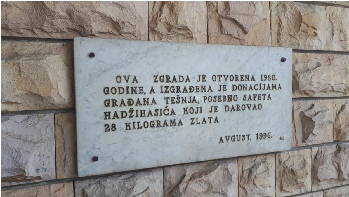
Sl. 7. Spomen ploča na zgradi Doma kulture u Tešnju