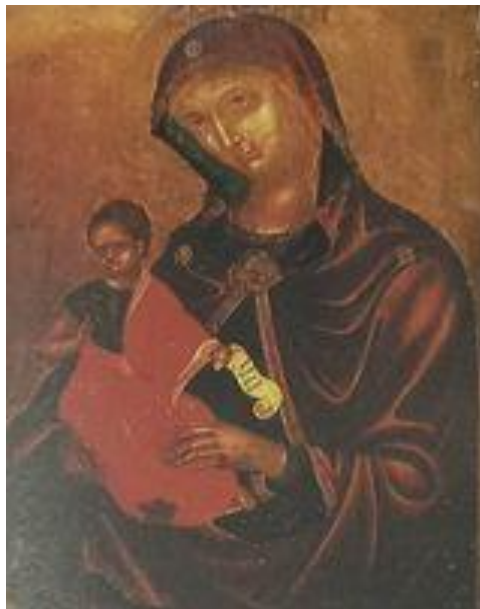
Slika 2. Bogorodica sa Hristom – Italo-grčki majstor – 15./16. Stoljeće - Retrospectum . Katalog. Sarajevo: Umjetnička galerija BiH. Sarajevo, 2008.