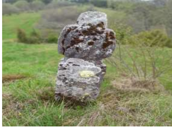
Slika 18. Zadnja strana nišana, prikaz jabuke ili kvrge