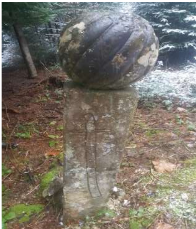
Slika 22. Nišan s prikazom sablje na stanu, Hrančiči