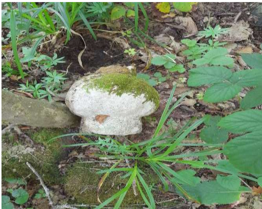
Slika 46. Fragment esnafskog nišana s mezarja u Naseocima

Stanje ostalih nišana na ovom mezarju najbolje pokazuje idući primjerak koji vrijedi spomenuti. Riječ je o nišanu koji je odlomljen od ostatka nišana i nalazi se u veoma lošem stanju. Turban jasno ukazuje da je riječ o esnafskom nišanu. Istrošenost gužvi ukazuje na starost nišana, a i samog lokaliteta, pa nije moguće tačno utvrditi kada je ovaj prostor postao aktivan izuzev toga da ovakva vrsta nišana pripada drugoj fazi izrade.