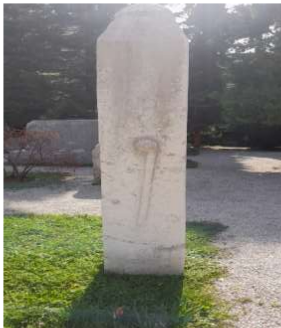
Slika 1. Nišan iz groblja kod Ali-pašine džamije