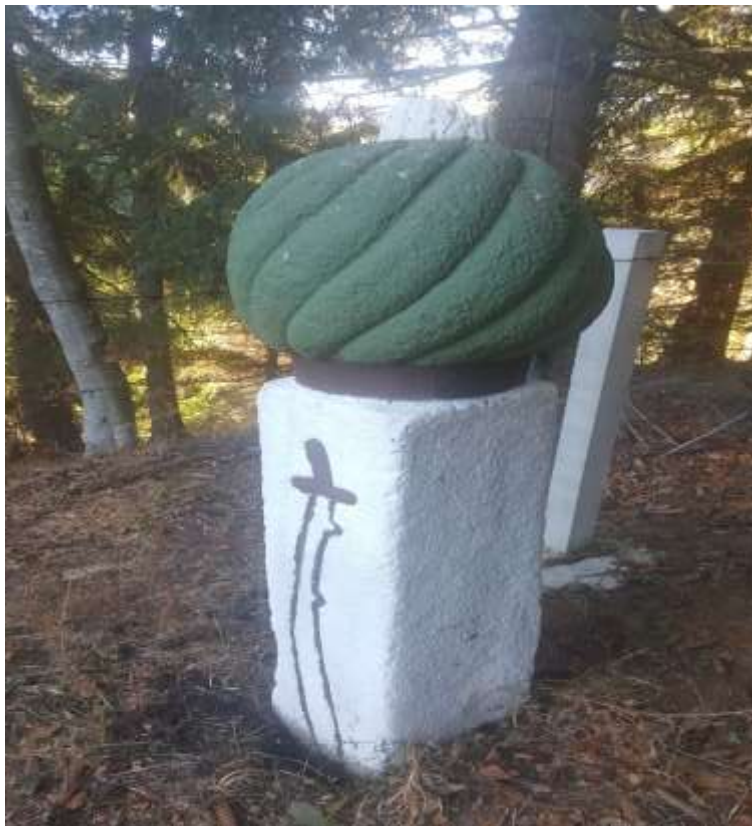
Slika 23. Nišan iz sela Žižci

da je visina kavuka 10 cm, turbana 60 cm, vrata 11 cm i stana 103 cm. Obim kavuka je 51 cm, dok je obim turbana 175 cm; obim vrata 118 cm i debljina 95 x 35 cm. Visina uznožnog nišana je 142 cm i debljina mu je 28 x 32 cm. Na ovom turbanu nema poprečnog prevoja preko gužvi.