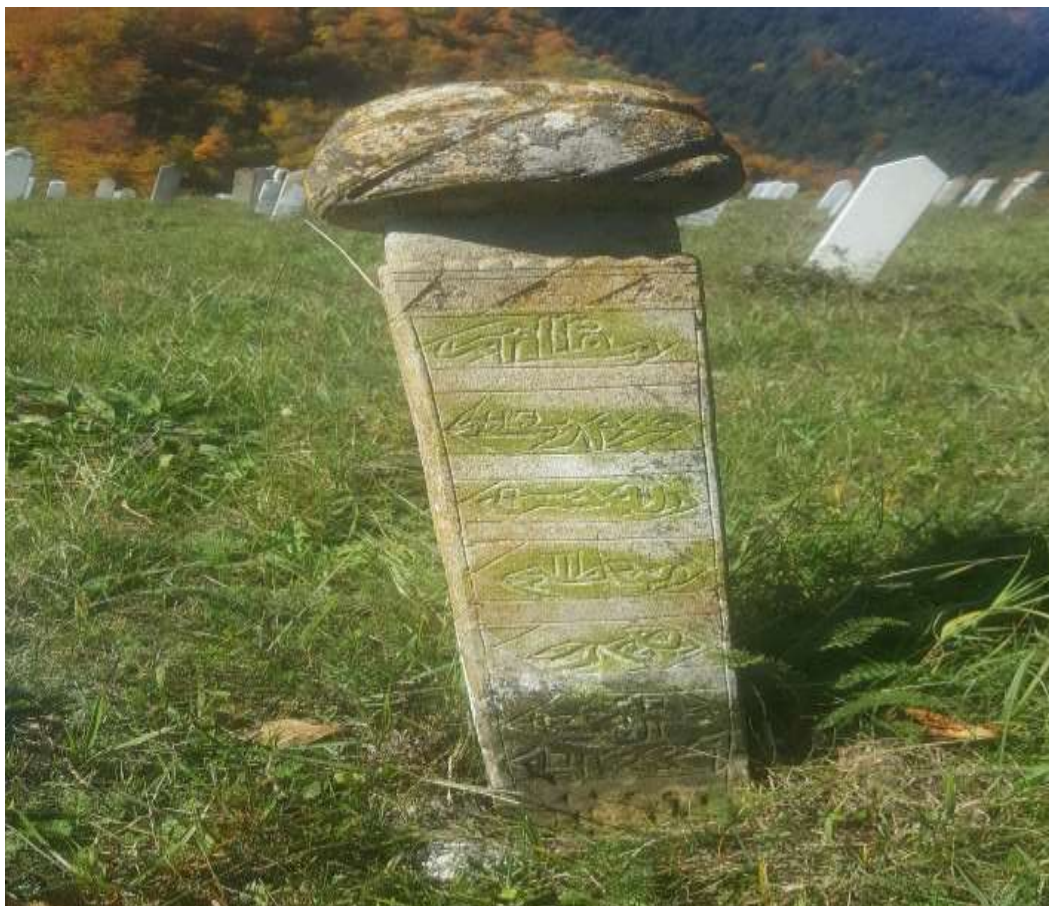
Slika 62. Nišan na arebici

nišana ogledaju se kroz nedostatak kavuka na vrhu turbana, dok je ostatak samog nišana očuvan u savršenom stanju.