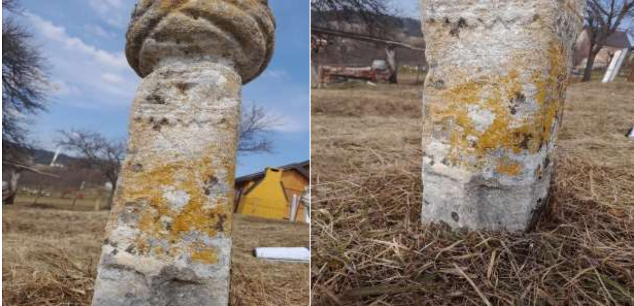
Slike 59. i 60. Nišan s prikazom nadžak oružja, dvije strane

Neka pitanja o ovome nišanu definitivno su još uvijek otvorena za nauku. Ukoliko je riječ o ulemanskom nišanu, mogućnost prikaza čekića je nerealna. Štap koji se nazire na prikazu vjerovatno bi simbolizirao pokojnika koji ga je nosio u zadnjim godinama svog života. Štap i jeste asocijacija na starost i slabije kretanje ljudi. Treba ostaviti i mogućnost da se na prikazu nišana nalazi ratni pijuk, što bi ukazivalo na činjenicu da je na ovom mjestu sahranjen neki vojnik ili učesnik u nekom ratu. Ono što još krasi ovaj nišan je autentičan prikaz, koji je na granici između stana i vrata te se očituje većim brojem trouglova za razliku od drugih nišana koji su analizirani u ovom radu.