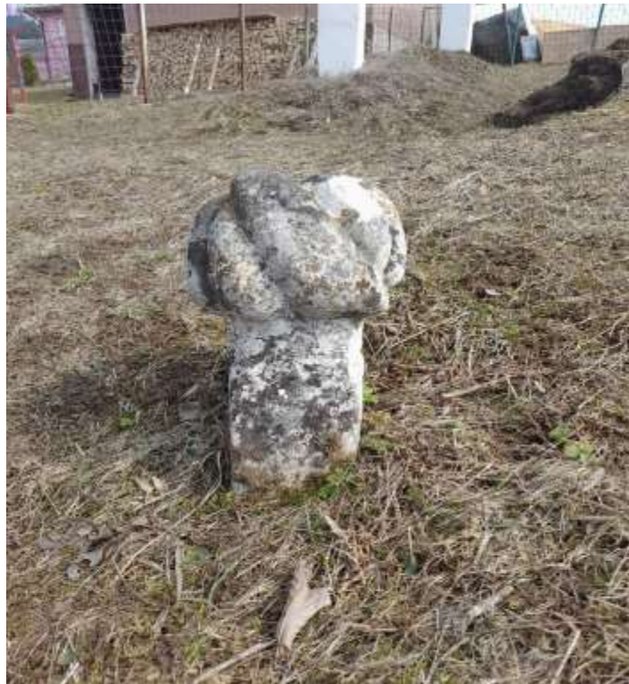
Slika 58. Esnafski nišan s tugom

Prilikom istraživanja ovog prostora nije se naišlo na stare ženske nišane, dok je nekoliko muških oštećeno. Esnafski nišan, koji na sebi ima poprečni prevoj odnosno tug, svjedoči da je unutar ovog društva bilo uglednih ljudi na osnovu imovinskog stanja i zanimanja. Turban na esnafskom nišanu je vješto izrađen, gužve se nalaze u izuzetnom stanju. Ali ovo je jedan od nišana koji na sebi nemaju kavuk, ne zato što je uklonjen nego zato što je takva vrsta nišana. Dužina turbana je 17 cm, dužina vrata 10 cm, dužina stana 19 cm. Širina vrata je 11 x 9 cm i stana 12 x 10 cm. Nišan na sebi nema određenih prikaza niti natpisa.