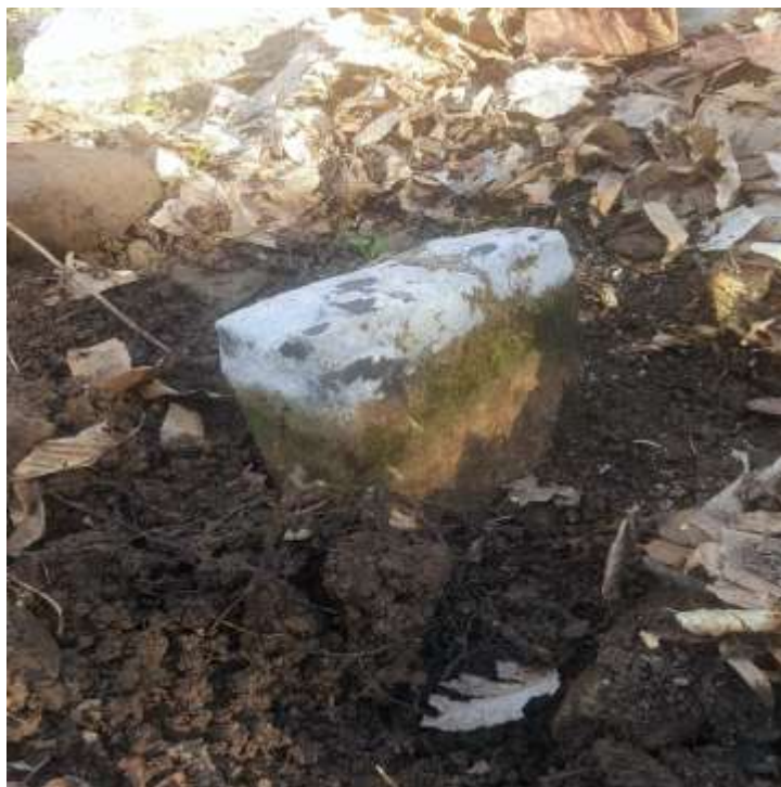
Slika 61. Fragmenti jednog nišana iz Kopjara

U selu Kučevci nije pronađen niti jedan nišan. U katastarskim popisima moguće je pronaći jednu parcelu koja u svom nazivu moguće da posjeduje groblje, ali nišana na tom prostoru nema, niti bilo kojih drugih nadgrobnih spomenika. Posljednje prezime iz ovog kraja su Crepulje, ali su oni vremenom odselili s ovog područja jer je putna infrastruktura koja povezuje selo u veoma lošem stanju.