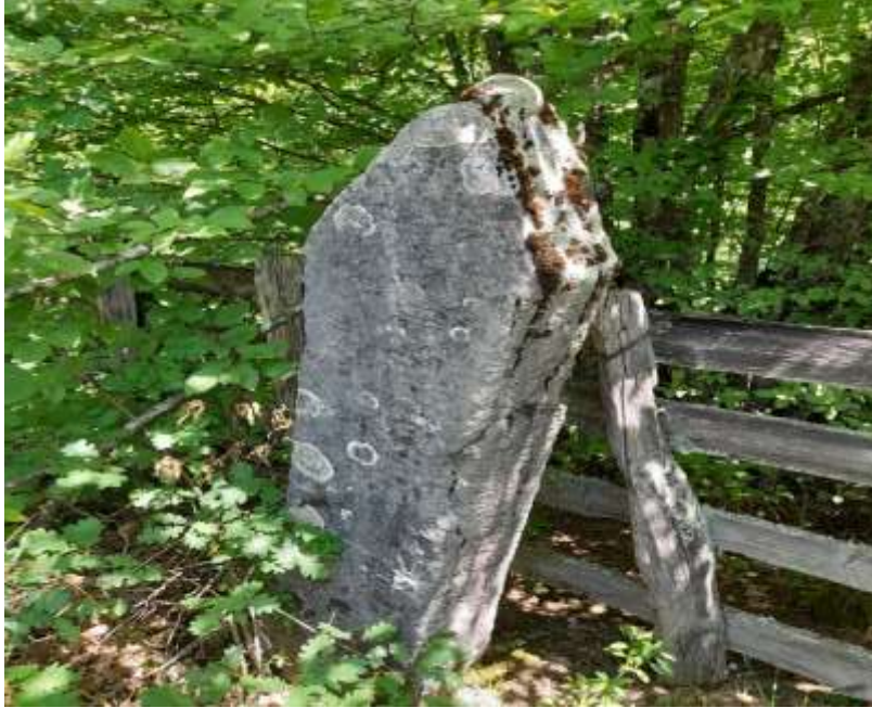
Slika 56. Uznožni nišan s lokaliteta Ropovice