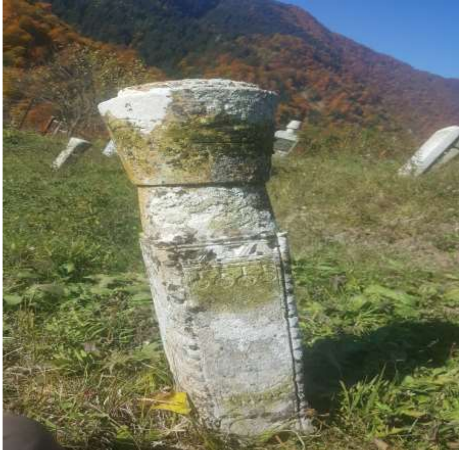
Slika 64. Ženski nišan

Posebno interesantno na ovom ženskom nišanu svakako je ukras koji se prostire od donjeg dijela stana, pa do kape nišana. Zajedno s tordiranom vrpcom na četiri ivice, može se reći da je nišan veoma bogato ukrašen. Bez pisanih tragova nije moguće utvrditi da li se radi o djevojačkom nišanu. Takva hipoteza se navodi na osnovu forme. Na sljedećem analiziranom nišanu nalazi se kvalitetniji prikaz ukrasa, ali manji u odnosu na prethodni na kojem su ukrašene sve četiri strane posebno bez natpisa. Zbog same forme može se zaključiti da se radi o djevojačkom nišanu. Ostali nišani s ovog prostora nisu najbolje sačuvani da bi se detaljnije predstavili.