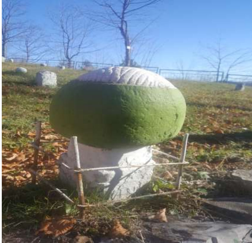
Slika 25. Derviški nišan helvetijskog tarikata, Karići

Još jedan helvetijski derviški nišan nalazi se na ovom mezarju u Karićima. Riječ je o nešto starijem nišanu s obzirom da se na njemu nalazi uklesana 1117. godina, računajući vrijeme prema hidžretskom kalendaru. Ostaci natpisa na nišanu upućuju da je ovdje sahranjen izvjesni Osman. Oštećena je prednja strana turbana. Na nišanu su urezane linije koje sliče trouglu bez donje stranice, s tim da postoji niz od više linija koje su nanizane jedna ispod druge u razmaku od 2 do 3 cm. Visina ovog nišana iznosi 60 cm, visina kavuka 10 cm i turbana 19 cm. Visina stana je 26 cm, dok mu je obim 60 cm. Obim turbana je 82 cm.