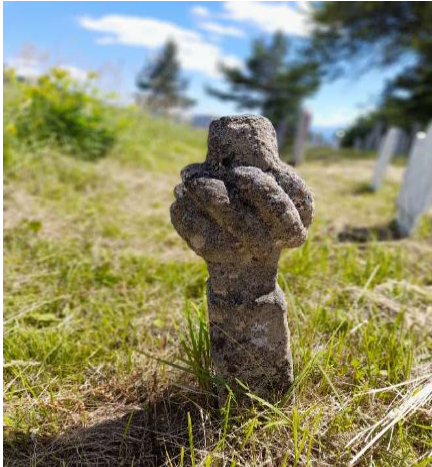
Slika 37. Esnafski nišan s područja lokaliteta Menice

Drugi nišan na istom lokalitetu karakterističan je po samoj formi izrade, a koji ima sličan izgled kao nišan s područja džemata Ravne. Nišan iz ovog džemata također na sebi ima natpis i godinu koja precizira tačno vrijeme izrade nišana. Riječ je o ženskom nišanu iz druge faze izrade. Ovakav nišan jednim svojim dijelom podsjeća na rustičnu stelu koja je prvobitno bila zastupljena u prvim godinama osmanske uprave na prostoru Bosne i Hercegovine.