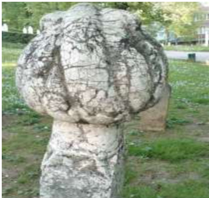
Slika 10. Oblik nišana koji govori da je riječ o uglednom pokojniku