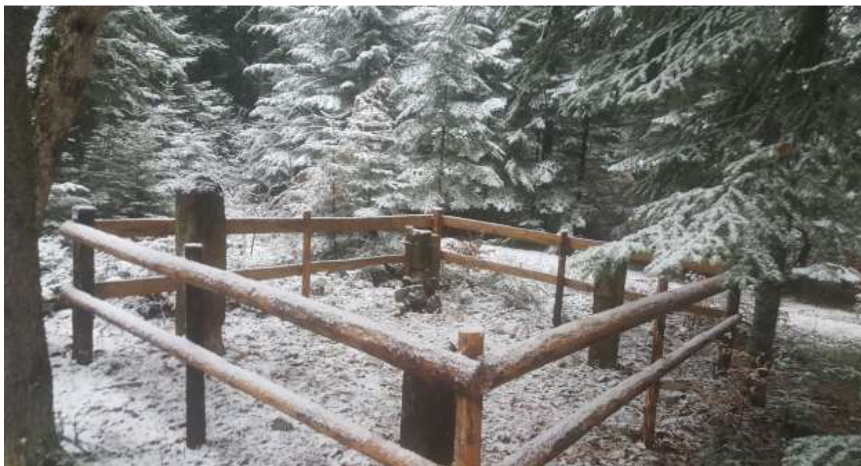
Slika 21. Nišani prve faze s orijentacijom sjever – jug, Hrančiči

Drugi nišan je orijentiran u pravcu sjeveroistok – jugozapad i izuzetno je velik, s oštećenjima na vratu nišana koji je slomljen, dok su turban i stan nišana očuvani. Na nišanu nema natpisa osim prikaza sablje u koricama na njegovoj lijevoj strani. Ono što je zanimljivo napomenuti kada se radi o prikazu sablji jeste da postoje sablje bez i sa koricama. Ne postoji precizan odgovor na takvu pojavu, osim što se tumači da oni nišani koji imaju prikaz sablje na sebi jesu šehidski nišani i to je primarno mišljenje koje se odnosi na bilo koji prikaz sablje. Kada se govori o veličini i obimu samog turbana koji na sebi ima gužve s poprečnim presjekom, on iznosi 110 cm, dok visina cijelog nišana iznosi 160 cm, a dužina sablje s koricama 70 cm. 127 Na osnovu poprečnog prevoja preko gužvi može se zaključiti da je pokojnik bio ugledan, a sam turban naglašava da se radi o krupnom zemljoposjedniku, uglednom trgovcu ili zanatliji.