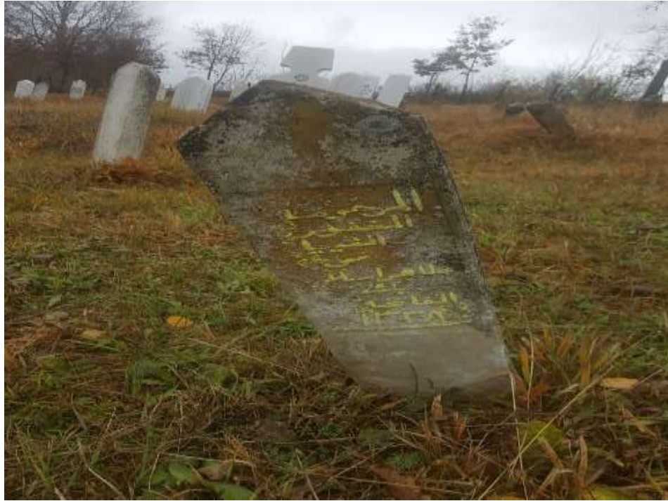
Slika 32. Ženski nišan na dvije vode, prikaz prednje strane s arebičkim tekstom

Pored muškog nišana treba spomenuti i ženski koji na svom stanu ima natpis s godinom 1337. prema hidžretskom kalendaru i odnosi se na 20. stoljeće – 1918. godinu koja je upisana kao godina smrti merhuma. Na nišanu je posebno interesantan tekst napisan na arebici, pismu koje nije bilo toliko popularno na vareškim nišanima. Na drugoj strani nišana nanizano je pet paralelnih linija s blagim nagibom prema lijevoj strani. Teško je tačno tvrditi namjere klesara, ali može se pretpostaviti da je pokušao natpis staviti u formu kurziva ili je pogriješio tekst.