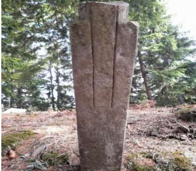
Slika 36. Nišan bez turbana