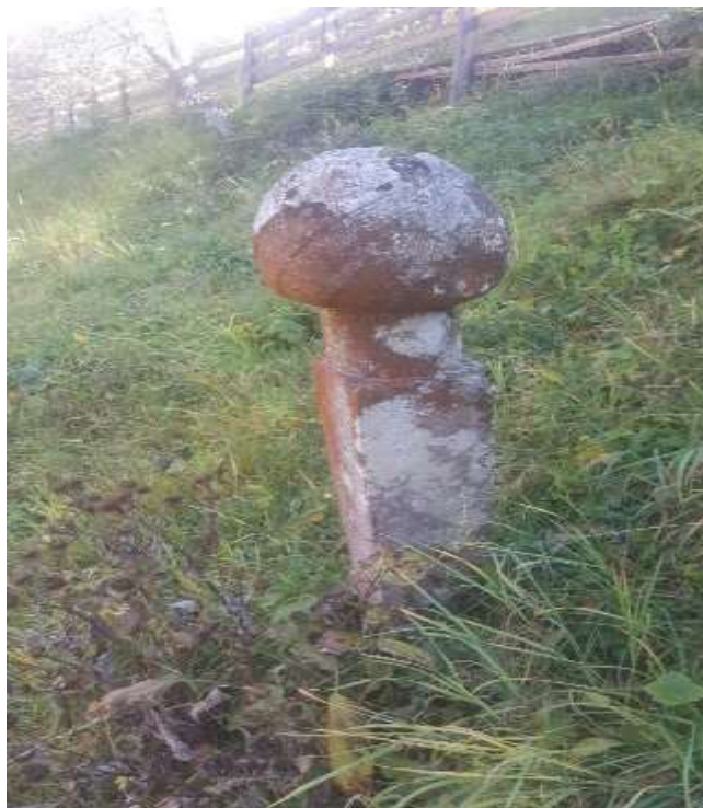
Slika 68. Esnafski nišan s mezarja u Jusama

Da je bilo i onih koji ukazuju na određen broj zemljoposjednika u ovom kraju svjedoči jedan odlomljeni nišan, vidljiv samo od vrata pa do vrha kavuka, dok ostaci nišana nedostaju.