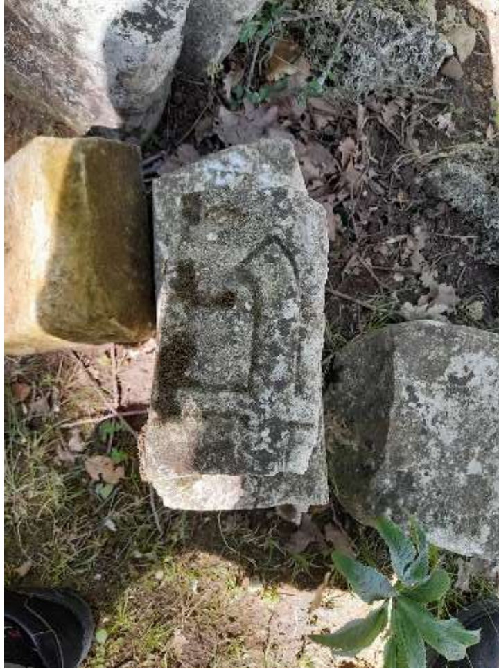
Slika 43. Fragment nišana s prikazom drške sablje ili mača

Na Hamzinom groblju veoma je zanimljivo pratiti granicu između dvaju mezaristana, što jasno upućuje na autentičnu tradiciju u ovom kraju. Ona se jasno razlikuje od tradicije u drugim grobljima.