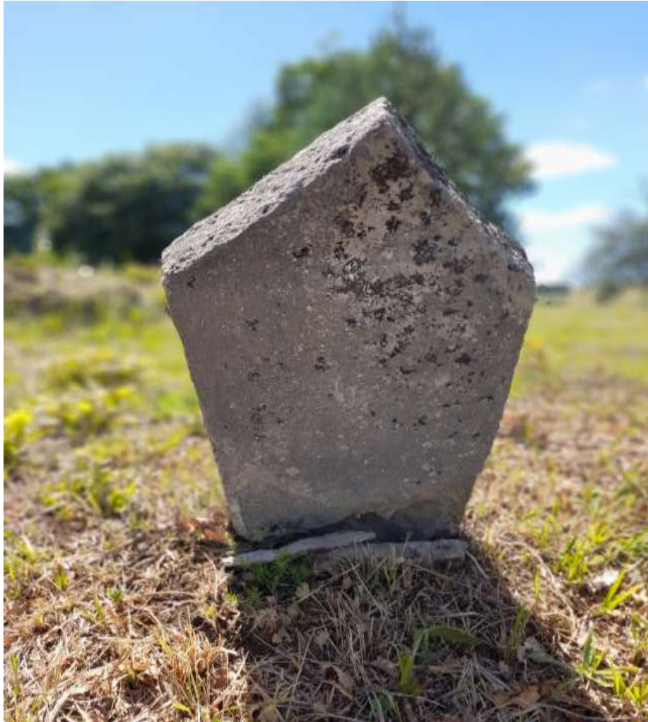
Slika 38. Ženski nišan s područja lokaliteta Menice

Na lokalitetu Menice pronađen je i zanimljiv muški nišan na kojem stoji i 1395. godina. Može se s pravom tvrditi da je natpis godine dodan kasnije ili je u pitanju klesarska greška. Također, moguće je pročitati i prva dva reda teksta na nišanu: