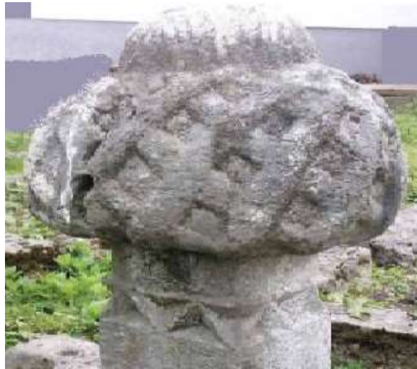
Slika 9. Nišan sa stalaktitnim ukrasom

činjenicom da hadžijski nišan karakteriše trouglasti stalaktitni ukras, dok Klinčević navodi u svojoj knjizi da je to glavno obilježje ove vrste nišana. 107