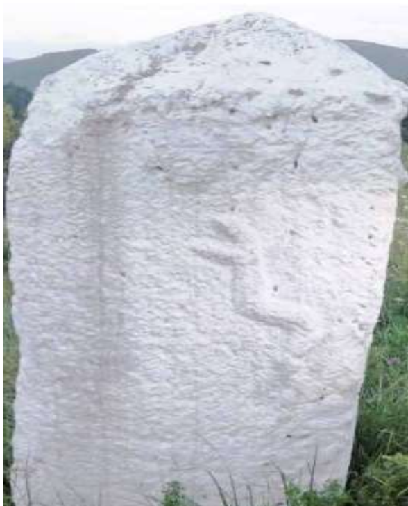
Slika 3. Isklesana zmija na nišanu iz Turova u Trnovu