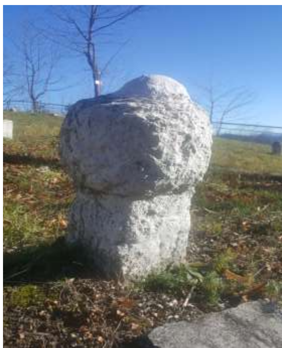
Slika 27. Nišan izrađen od sedre, Karići

Osim navedenih nišana u groblju se nalazi još jedan aginski nišan napravljen od sedre. Nema natpisa, a na turbanu se primjećuju oštećene gužve što je uzrokovano vrstom kamena od kojeg je napravljen. Nažalost, i stan i turban su djelimično oštećeni. Osnovne dimenzije ovog nišana iznose: 49 cm visina nišana, visina kavuka 6 cm, visina turbana 19 cm, visina vrata 6 cm, visina stana 18 cm. Obim turbana je 75 cm, obim vrata 57 cm dok je obim stana 17 x 18cm.