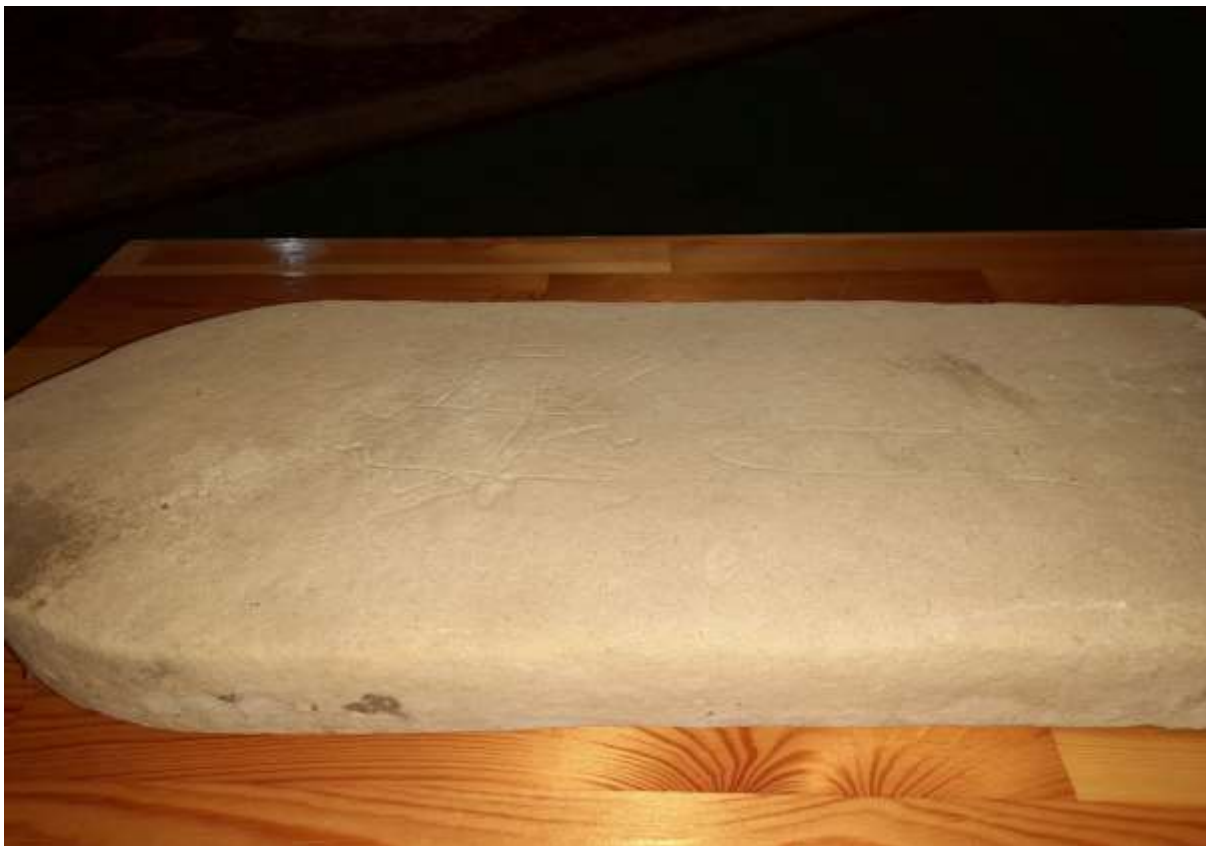
Slika 40. Nišan stela prve faze

Prvi nišan na Hamzinom groblju nalazi se u vareškoj tekiji. Čuva se na sigurnom mjestu od propadanja zbog samog sadržaja koji je prikazan na njemu. Shodno prikazu, nišan predstavlja prvu fazu izrade nišana. Šejh tekije u Varešu Azmir Muftić pronašao je ovaj nišan u Hamzinom groblju.