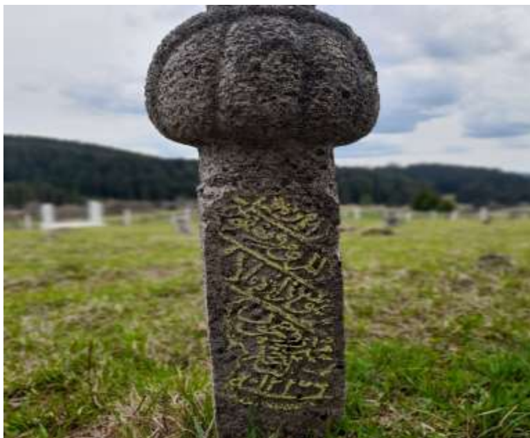
Slika 16. Nišan u gužvama s poprečnim prevojem preko turbana, Ravne