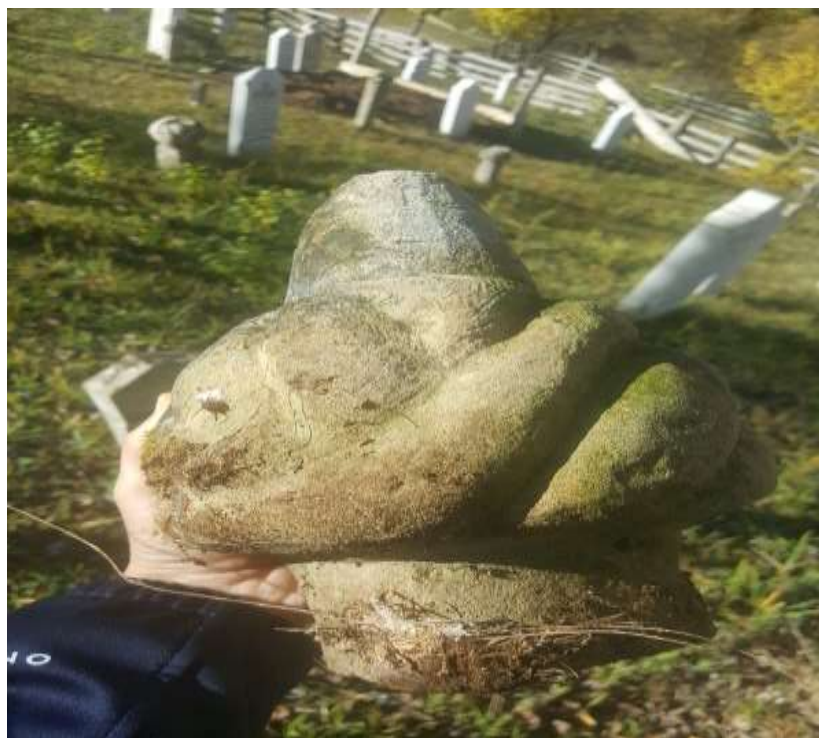
Slika 69. Odlomljeni dio nišana

Da je bilo i onih koji ukazuju na određen broj zemljoposjednika u ovom kraju svjedoči jedan odlomljeni nišan, vidljiv samo od vrata pa do vrha kavuka, dok ostaci nišana nedostaju.