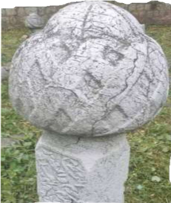
Slika 13. Ulemanski nišan s mušebek turbanom

Drugačiji pristup pri analizi ove vrste nišana daje Mujezinović. Mušebek turban izveden je u plitkom reljefu od poprečnih prevoja, a označava grobove visokoobrazovanih ljudi, kao što su muftije i muderisi. Ostali učeni ljudi imaju čatal turban ili turban na pero. To je obli turban koji je u sredini nešto tanji. 113