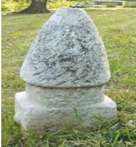
Slika 6. Nišan nakšibendijskog reda