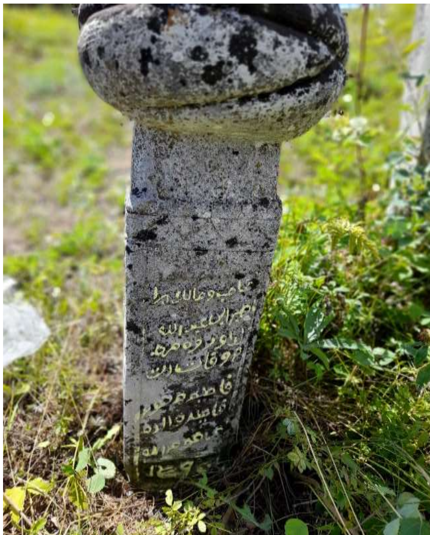
Slika 39. Muški nišan s područja lokaliteta Menice