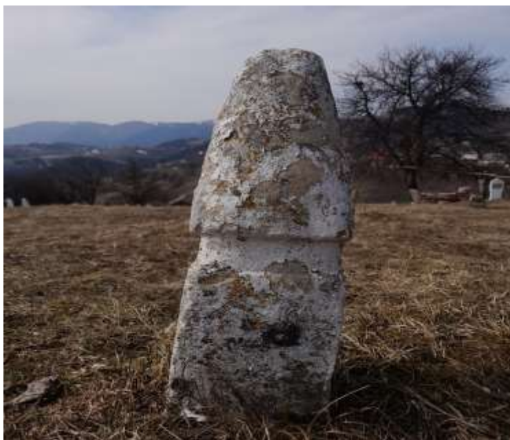
Slika 57. Derviški nišan nakšibendijskog tarikata

Ovo je jedini derviški nišan s ovog kraja, a pitanje tekije u Daštanskoj potrebno je još uvijek ostaviti otvorenim za istraživanje s obzirom da ne postoji dokaz da se ona nalazila u ovom selu. Treba spomenuti da je selo Daštanska udaljeno svega 4 kilometra od Karića, što ukazuje na blizinu mjesta koje je bilo omiljeno dervišima. U selu Karići djelovao je helvetijski derviški tarikat, dok za nakšibendijski tarikat nema materijalnih dokaza. Vjerovatno su uništeni tokom ratova na ovim prostorima. Derviški redovi su zasigurno na ovim prostorima odigrali veoma značajnu ulogu u razvoju i ulozi sela.