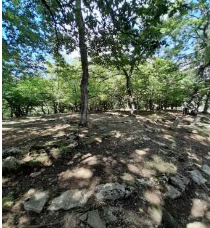
Slika 44. Prikaz groblja između mezaristana