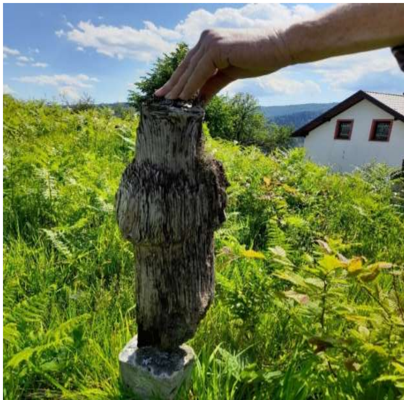
Slika 52. Nišan od drveta s turbanom

nemaju samo takvu vrstu nadkaburskog obilježja, nego posjeduju i drvene nišane s turbanom. Kroz literaturu nismo naišli na nišane koji su napravljeni od drveta niti se pominje takva vrsta. Nišan predstavlja domaću radinost i, prije svega, pokazuje koliko su ljudi pridavali značaj ovom dijelu života. Nišan izrađen od drveta bora krasi ionako interesantno i bogato mezarje u Ligatićima.