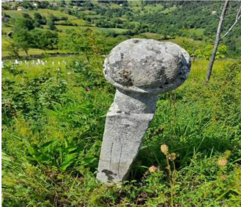
Slika 49. Vojnički nišan

Na slici ispod nalazi se prikazan ženski i muški nišan. Kod ženskog nišana istaknut je kavuk na vrhu kape. Na nekim drugim ženskim nišanima kavuk nije istaknut, nego je samo prikazan kao ravna ploha. Ono što je zanimljivo jeste da i na muškom nišanu na vrhu kavuka imamo kvrgu odnosno polujabuku. Na muškom nišanu nalaze se dva tuga, što pokazuje da je merhum za života bio ugledan i vrlo učen.