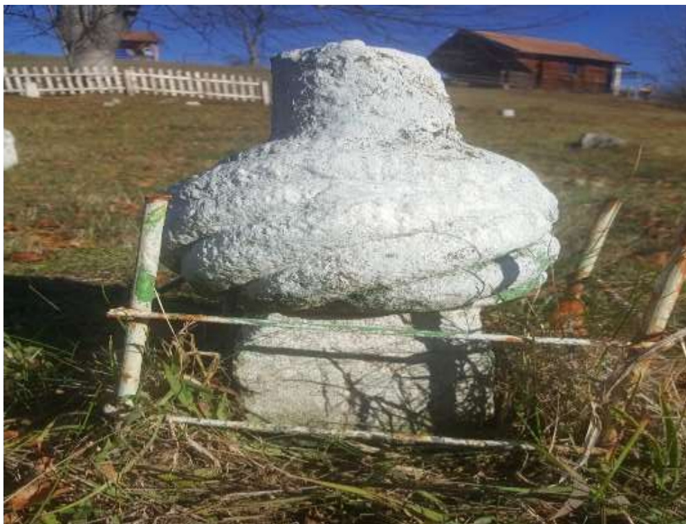
Slika 29. Esnafski nišan s kavukom, Karići