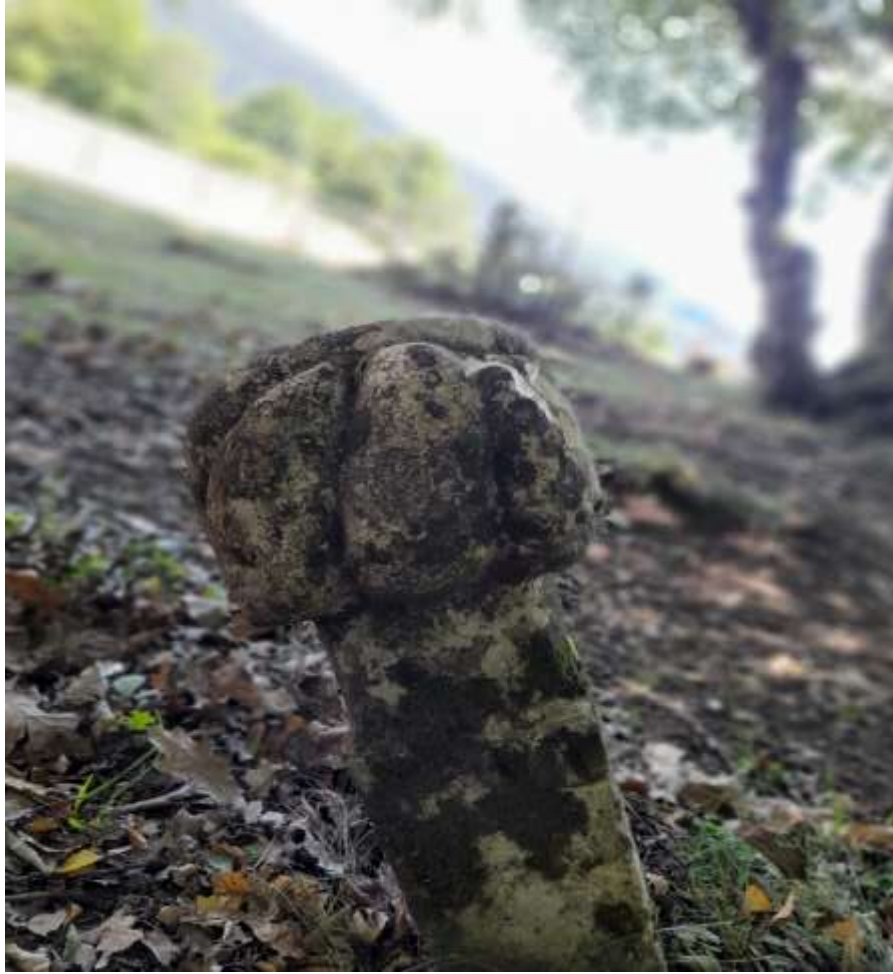
Slika 42. Prikaz dječijeg nišana

Fragmenti koji pokazuju stanje groblja jasno govore da je šehidskih nišana bilo mnogo u samom mezaristanu. Na idućem analiziranom nišanu može se vidjeti prikaz drške, vjerovatno od sablje ili mača.