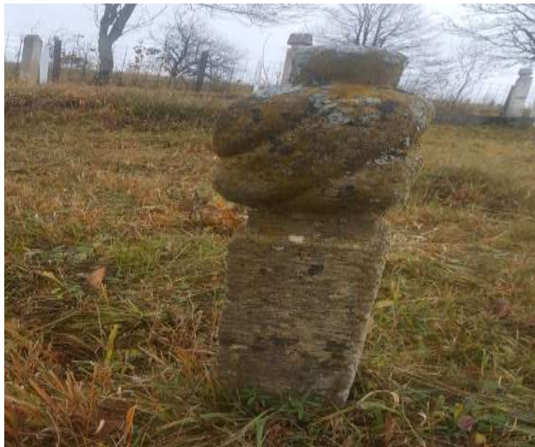
Slika 31. Muški nišan s oštećenim turbanom

Na osnovu rekognosciranja, nišani pripadaju drugoj fazi obrade. Većina njih nema natpisa na osnovu kojih bi se moglo saznati nešto više o samom merhumu. Posebno je zanimljiv jedan muški nišan s oštećenim turbanom, izrađen od kamena koji se nalazi u selu Budoželje. Ukupna visina ovog nišana je 71 cm, a od toga kavuk zauzima 4 cm. Visina turbana je 15 cm, vrata 6 cm, dok je visina stana 46 cm. Preostale dimenzije se odnose na debljinu vrata koja iznosi 10 cm i debljinu stana odnosno donjeg dijela nišana čija je dimenzija 12 cm. Vrijedi spomenuti da su ostali muški nišani lične izrade, ali različite dimenzije pri visini i širini.