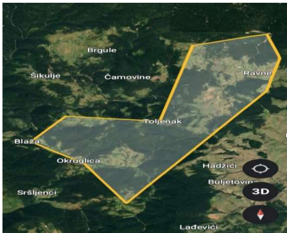
Slika 15. Položaj sela Blaže u odnosu na okolna mjesta

U okviru sela Blaža 114 prvi dostupni podaci mogu se naći u popisu iz 1604. godine. Tada se ovo mjesto spominje kao selo, a ime je dobilo po istoimenoj rijeci koja protječe tim područjem, koje se nalazi jugoistočno od Vareša. Popis iz 1604. godine donosi važne podatke prije svega o demografiji. Ovdje se navode 83 muslimana s baštinama. Vrlo važno je imati na umu da je Blaža u to vrijeme pripadala Dubrovačkoj nahiji koja je zauzimala ne samo taj dio današnje opštine Vareš nego više naselja koja su potpadala pod okrilje ove nahije. Prihod ove zajednice u to vrijeme od muslimana iznosio je 6.023 akče. Na osnovu popisa može se utvrditi da su na ovom području pored muslimana živjeli i pravoslavci. 115