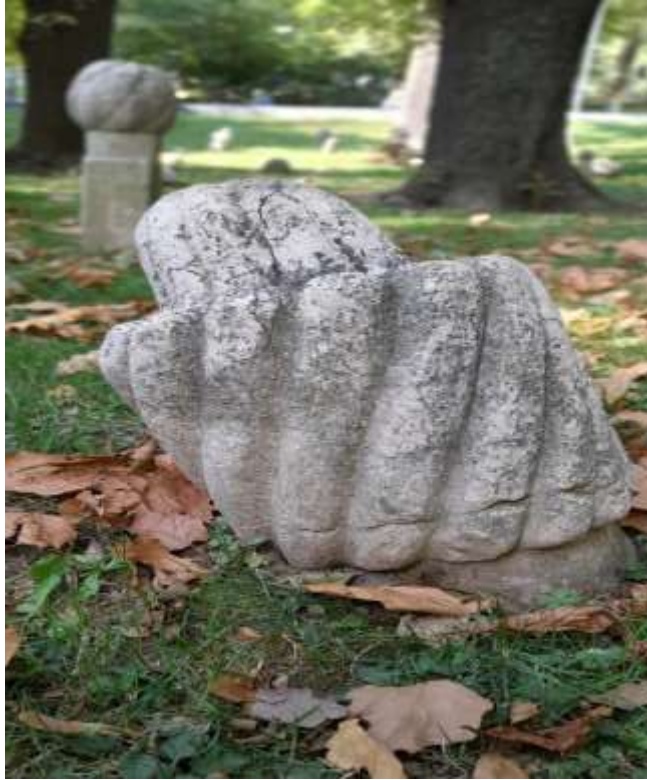
Slika 5. Aginski nišan