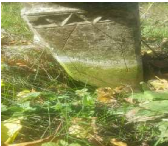
Slika 70. Prvi nišan iz Moćila

Na nišanu ispod teksta ne postoji neki natpis, osim prikaza koji se ne može sa sigurnošću rekonstruirati. Može se pretpostaviti da je pokojnik bio istaknuta osoba što se vidi na osnovu fino obrađenog trodimenzionalnog prikaza na granici između stana i vrata nišana.