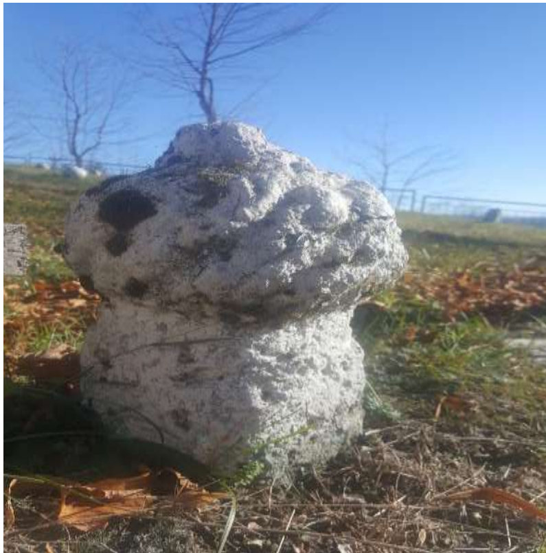
Slika 24. Nišan od sedre

Posebno je interesantan nišan koji se nalazi na samom početku ulaza u groblje. Njegova visina je 40 cm, dok visina kavuka iznosi 5 cm. Turban je visok 18 cm, a dužina vrata iznosi 5 cm. Obim turbana je 60 cm, vrata 45 cm, dok je obim stana 52 cm. Nišan je izrađen od sedre bez natpisa. Pretpostavka je da se radi o aginskom nišanu, ali zbog oštećenja turbana nije moguće sa sigurnošću to tvrditi.