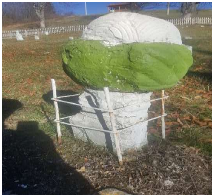
Slika 26. Nišan s gužvama s oštećenom prednjom stranom na turbanu, Karići

Osim navedenih nišana u groblju se nalazi još jedan aginski nišan napravljen od sedre. Nema natpisa, a na turbanu se primjećuju oštećene gužve što je uzrokovano vrstom kamena od kojeg je napravljen. Nažalost, i stan i turban su djelimično oštećeni. Osnovne dimenzije ovog nišana iznose: 49 cm visina nišana, visina kavuka 6 cm, visina turbana 19 cm, visina vrata 6 cm, visina stana 18 cm. Obim turbana je 75 cm, obim vrata 57 cm dok je obim stana 17 x 18cm.