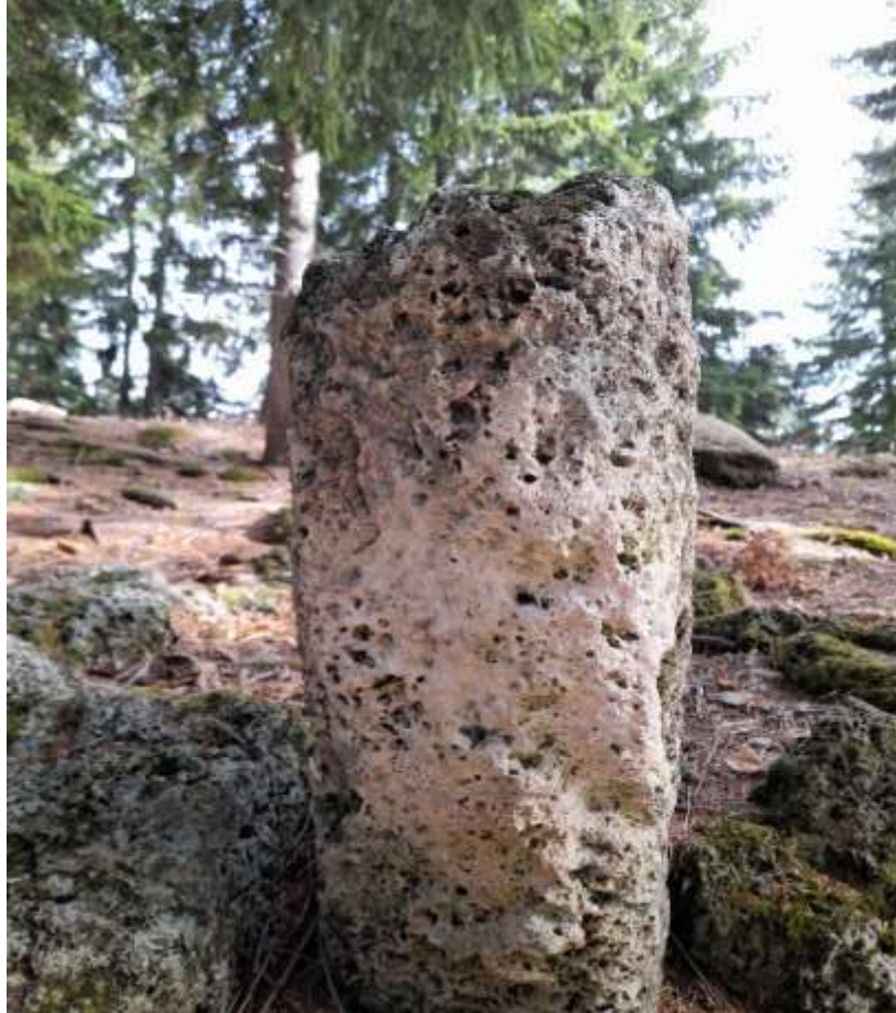
Slika 35. Nišan od sedra bez turbana

Sljedeći nišan je zanimljiv po prikazu na svojoj zadnjoj strani, a radi se o paralelnim linijama koje se spuštaju od preloma na vratu do sredine stana nišana, gdje se dalje sužavaju i naslanjaju na jednu manju vodoravnu liniju. Obzirom da se nalazi sa zadnje strane i da se prema dnu sužava, pretpostavka je da se radi o ženskom nišanu, a da je ovo zapravo prikaz pletenice. Pošto nema ženske kape na kojoj bi se nalazili solufenci, ne može se sa sigurnošću tvrditi da se radi o ženskom nišanu. Postoji mogućnost i da je riječ o derviškom nišanu, i to nakšibendijskom. Jedini su nakšibendijski nišani imali liniju koja se pružala od turbana prema stanu nišana.