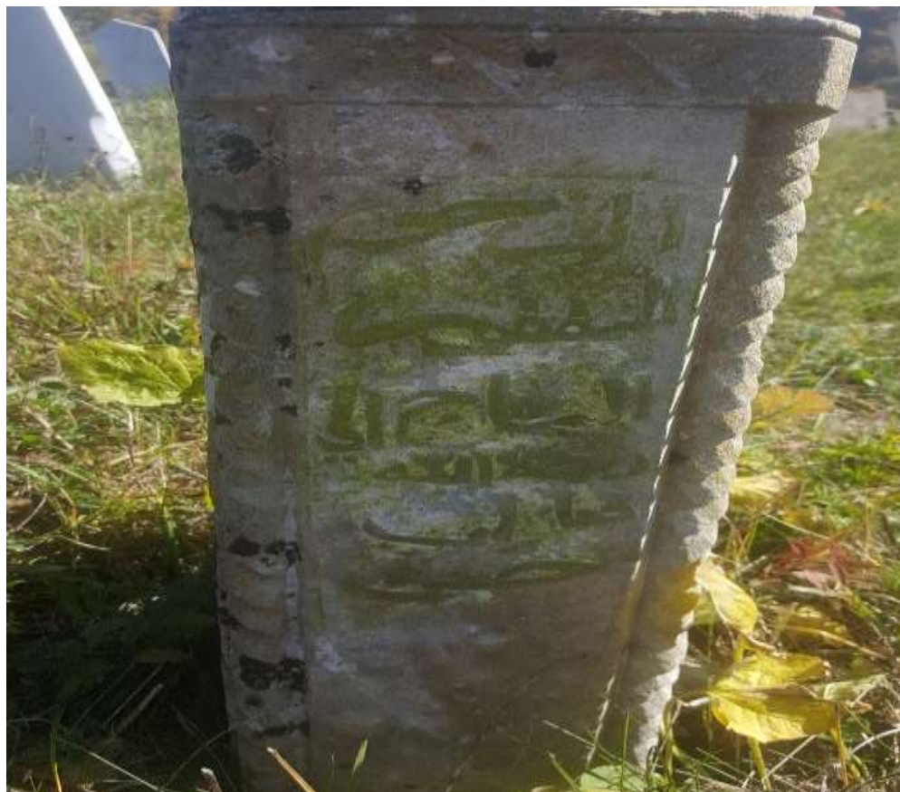
Slika 63. Natpis na stanu od esnafskog nišana

stanovnika Edhema Aščerije, rod Adilovića je došao na ovo mjesto umjesto porodica Mutapdžija koje nisu imali muških nasljednika, pa se njihova loza prekinula. 167