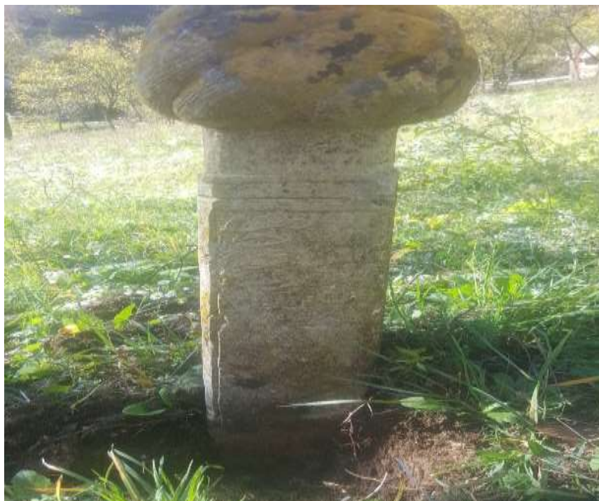
Slika 72. Zagonetni nišan iz Močila

prostoru Mijakovića i Dragovića. Treba napomenuti da se pored Aščerija naselilo u Dragoviće još par porodica, počevši od Kovačevića, Sarača, Adilovića upravo iz Nažbilja. 171