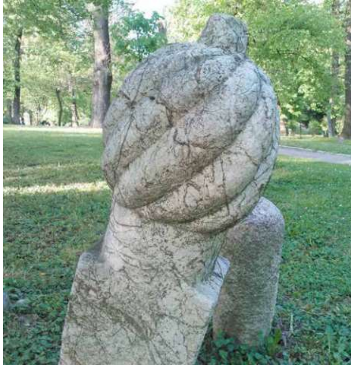
Slika 8. Esnafski nišan