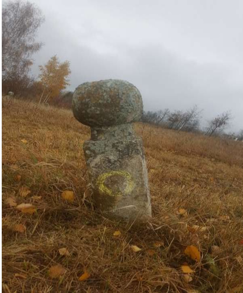
Slika 34. Prikaz prednje strane esnafskog nišana iz sela Budoželje

Bogata nišanima je i lokacija džamije smještene u haremu u Budoželju. Džamija je rekonstruirana 1938. godine, a vjerovatno je na ovom prostoru i prije džamije postojao vjerski objekat. Jedan derviški nišan mogao bi upućivati na postojanje derviške tekije na ovom mjestu. Bešlagić navodi kako je nekropola s nišanima smještena na zemljišnim parcelama gdje je aktivno muslimansko groblje. Na jednom od nišana kojeg opisuje Bešlagić evidentirana je 1719. godina. 134 Taj nišan nismo uspjeli pronaći i analizirati.