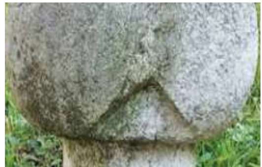
Slika 14. Čatal turbani, geometrijski prikaz