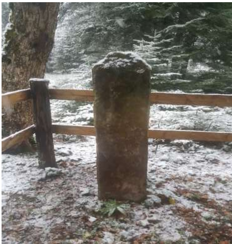
Slika 20. Nišan s kvrgom na vrhu ispod piramidalnog završetka

O doseljavanju na prostor Hrančića 126 ne postoji puno relevantnih podataka koje bismo mogli smatrati tačnim i autentičnim. Posjedi ili čifluci uglednijeg stanovništva nalazili su se u Hrančićima. Na groblju, koje se nalazi između Kadarića i Debele Međe, na šumskom putu smještene su tri oštećene stele čiji je završetak piramidalan. Na bočnim stranama ostataka od nišana postoje ostaci kvrga ili jabuka koje bi mogle upućivati na rane pokojnika. Orijehtacija starih nišana po dva para je sjever – jug, što ukazuje na još jednu bitnu stavku kada je u pitanju starost nišana. Dakle, vrlo je česta pogreška prilikom orijentacije nišana bila prisutna u vremenu prve faze izrade nišana. Dimenzije ovih nišana su slične onima koje se odnose na nišan koji ima na sebi kvrgu odnosno jabuku. Ukupna visina je 150 cm, dok je širina 28 x 24 cm.