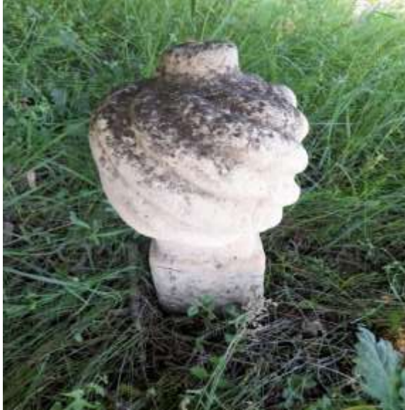
Slika 53. Esnafski nišan u Mižnovićima