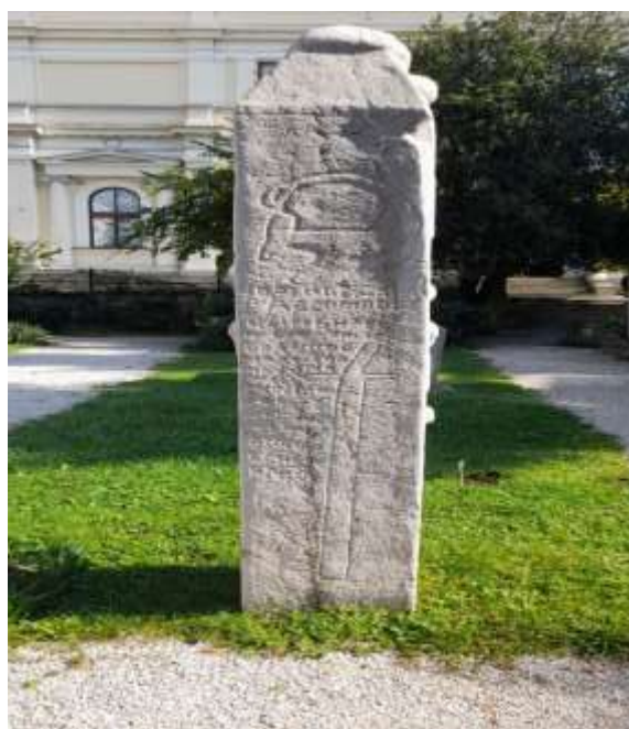
Slika 2. Nišan Mahmuta Brankovića

Bešlagić spominje sedam ovakvih primjera nišana iz ranijeg perioda, a nišan Mahmuta Brankovića svakako je najreprezentativniji primjerak i danas se čuva u Zemaljskom muzeju u Sarajevu. Kao što je već napisano, nišani prve faze raspoznaju se prema prikazima na njima, a Bešlagić analizom terena navodi pojavu različitih motiva na nišanima, uglavnom inspirisanih životinjskim motivima. Na nišanima se susreću prikazi ptice, konja, jelena, vepra, lava, zmije, psa, te predstava čovjeka. 44