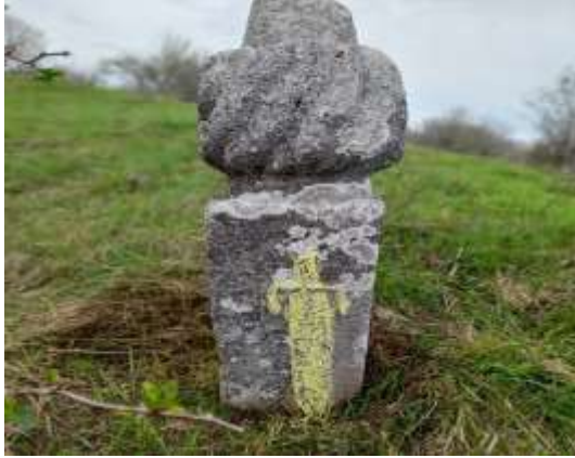
Slika 17. Prednja strana nišana, prikaz mača