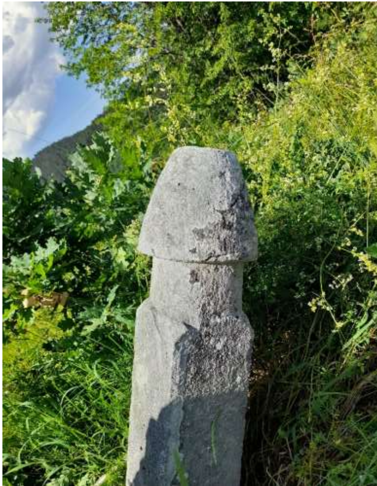
Slika 51. Derviški nišan nakšibendijskog tarikata

Pored spomenutih, na mezarju u Ligatićima zastupljeni su i derviški nišani. Za razliku od ranijih derviških nišana koji su obrađeni, a pripadaju helvetijskom redu, ovi pripadaju nakšibendijskom tarikatu, što je veoma zanimljivo jer na osnovu različitih derviških nišana mogu se pratiti granice sela i mezaristana te prisutnosti derviških redova u njima. Na derviškom nišanu nalazi se nekoliko oštećenja, pa je teško dati neki detaljniji opis. Na samom nišanu nema ni nekih jasnih prikaza. Pošto je ovo derviški nišan, postavlja se pitanje gdje je i da li je u blizini bila smještena tekija?