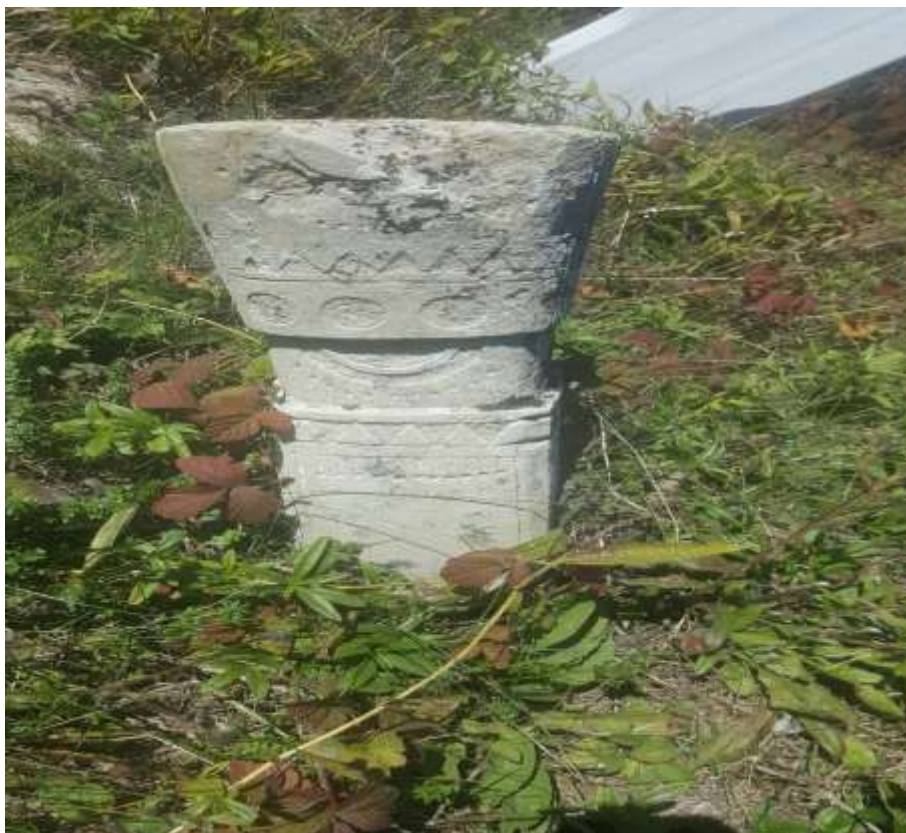
Slika 65. Ženski nišan s ukrasima na kapi

Naredna lokacija koja je rekognoscirana je ona na Torevinama. Kroz razgovor s lokalnim stanovništvom došlo se do saznanja da je prilikom spajanja dvaju sela Dragovići i Mijakovići na glavnoj cesti mezaristan potpuno uništen 1989. godine. 168 To dovoljno govori o nemaru lokalnih vlasti prema kulturno-historijskom naslijeđu. Torevine se ne smiju zaboraviti i iz razloga što se u blizini nalazi ulaz na sjevernu kapiju srednjovjekovne utvrde Bobovac. Ono što je važno spomenuti za taj prostor jeste da je tu smješten stećak, što bi moglo aludirati na to da je na tom prostoru nastavljen ukop i nakon dolaska Osmanlija. Na osnovu ranijih izvještaja koja su prikupljena od stanovništva, vlasnika imanja, na tom mjestu nalazile su se i ljudske kosti. Dio greblja je pod šumom i ne postoje nikakva obilježja koja bi pokazala o kojoj vrsti nadgrobnih spomenika je riječ.