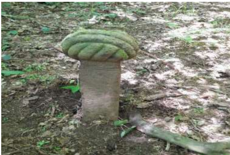
Slika 45. Prvi nišan iz mezarja u Naseocima

Prvi nišan koji je obrađen jedan je od rijetkih nišana na koji se naišlo tokom istraživanja. Zeleni tuf je, po svemu sudeći, uvozni materijal od kojeg je izrađen ovaj nišan. To ujedno govori o imovinskom stanju, odnosno zaostavštini merhuma. Turban je sam po sebi specifičan, zbog čega u nastavku rada zahtijeva detaljniji analitički pristup. Sve upućuje na to da je riječ o imućnijem pokojniku.