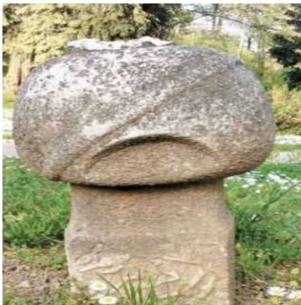
Slika 11. Ulemanski nišan s prevojem