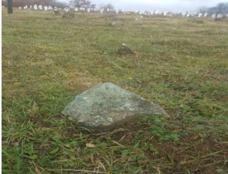
Slika 30. Rustična stela iz mezaristana u Budoželju

Na osnovu rekognosciranja, nišani pripadaju drugoj fazi obrade. Većina njih nema natpisa na osnovu kojih bi se moglo saznati nešto više o samom merhumu. Posebno je zanimljiv jedan muški nišan s oštećenim turbanom, izrađen od kamena koji se nalazi u selu Budoželje. Ukupna visina ovog nišana je 71 cm, a od toga kavuk zauzima 4 cm. Visina turbana je 15 cm, vrata 6 cm, dok je visina stana 46 cm. Preostale dimenzije se odnose na debljinu vrata koja iznosi 10 cm i debljinu stana odnosno donjeg dijela nišana čija je dimenzija 12 cm. Vrijedi spomenuti da su ostali muški nišani lične izrade, ali različite dimenzije pri visini i širini.