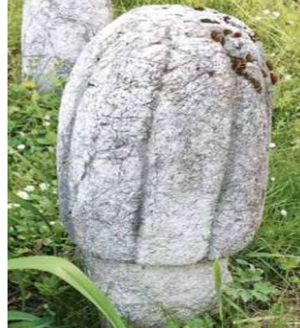
Slika 7. Nišan kaderijskog reda