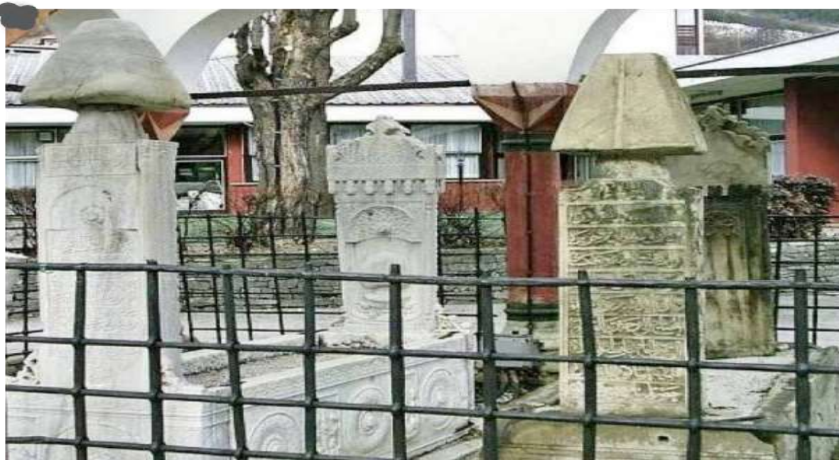
Slika 12. Pašinski nišani

Visoki vojni ili civilni službenici ukoliko bi određenu aktivnost odradili na poseban način ali s pozitivnim posljedicama, dobijali bi počasnu titulu paša . Ono što je zanimljivo kod ove počasne titule je to što je ona dolazila odmah nakon ličnog imena. 109 Nišani vezira i drugih dostojanstvenika imaju četverostranu pri vrhu presječenu piramidu. Njihovi turbani posjeduju tanke pljosnate prevoje, a ponekad su označeni i tugovi. 110 Postoje dva oblika ovih nišana s oštrim i sa zaobljenim ivicama na piramidalnom turbanu. 111