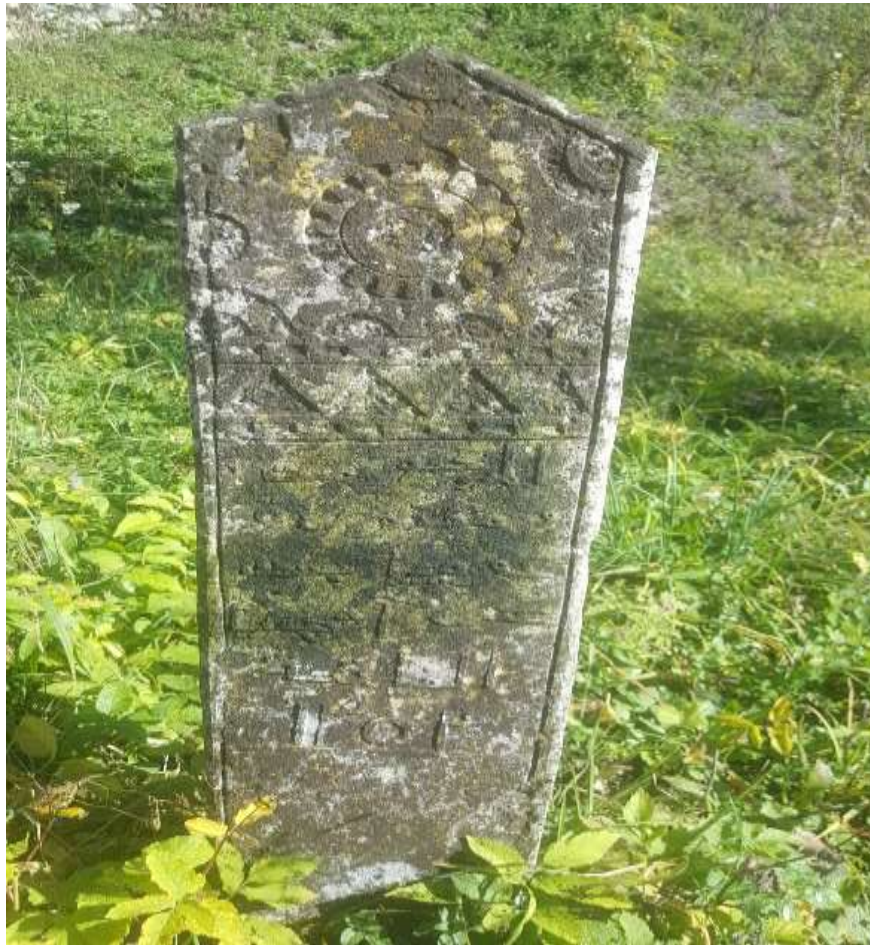
Slika 71. Ženski nišan na dvije vode

istaknuti kako ga od ostalih obrađenih nišana u radu izdvaja astralni prikaz na vrhu samog nišana. Nišan se nalazi na dvije vode.