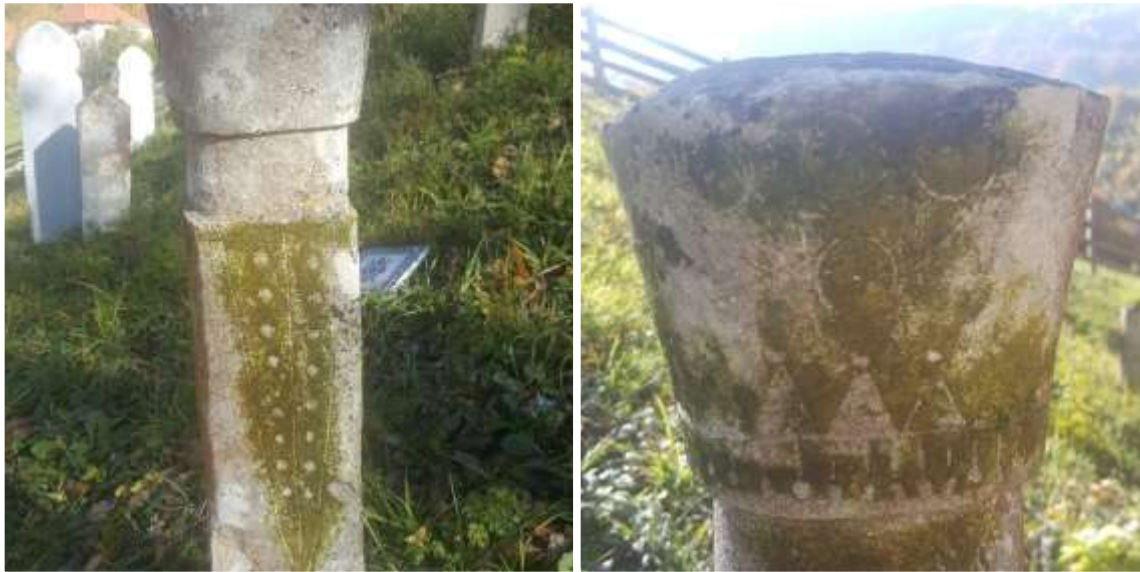
Slike 66. i 67. Prikazi nišana s ukrašenim stranama

Sljedeća lokacija na kojoj se istraživao broj starih nišana je mezaristan u selu Juse. 169 Na ovom prostoru nalazi se ukupno šest starih nišana, dok ostatak čine mlađi nišani. Prvi od obrađenih nišana je ženski s ukrašenom kapom i različitim ukrasima krenuvši od stana nišana, pa do vrata i to na sve četiri strane nišana.