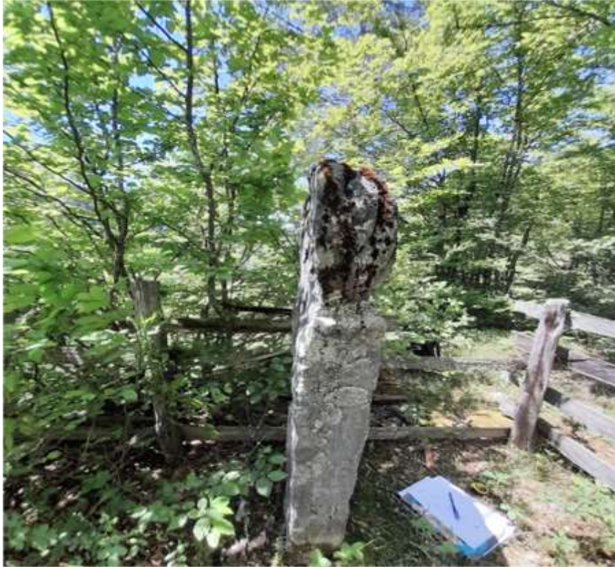
Slika 55. Prikaz oštećenog nišana iz Ropovice

Prema Muftićevim riječima, postojalo je još jedno groblje koje je smješteno u blizini ovog nišana, mada nije bilo pristupačno obzirom da je ovo područje obraslo gustom šumom. U okolici ovog nišana nalazi se nekoliko kuća. Brigu o ovom nišanu vode stanovnici iz sela Ligatići i oni su ga ogradili i zaštitili. Također, sačuvan je uznožni nišan na kojem je zapažen detalj kvрге, odnosno jabuke na vrhu samog nišana. Ukupna visina nišana iznosi 178 cm bez kavuka, od toga 50 cm zauzima turban, 8 cm vrat i 120 cm stan nišana, dok mu je širina 41 cm. Ako se uzme u obzir da nedostaje kavuk, onda bi cjelokupna visina bila preko 180 cm. Isti slučaj je i sa širinom. To što mu nedostaje jedna polovina govori da je debljina ovog nišana išla i do 80 cm. Dimenzije uznožnog nišana iznose 158 cm ukupna visina, dok je širina 33 cm.