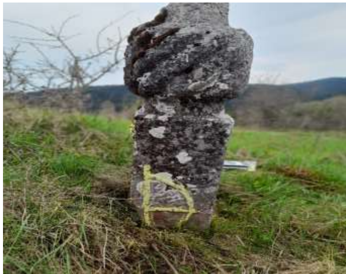
Slika 19. Bočna strana nišana iz Kunošića, prikaz luka i strijele