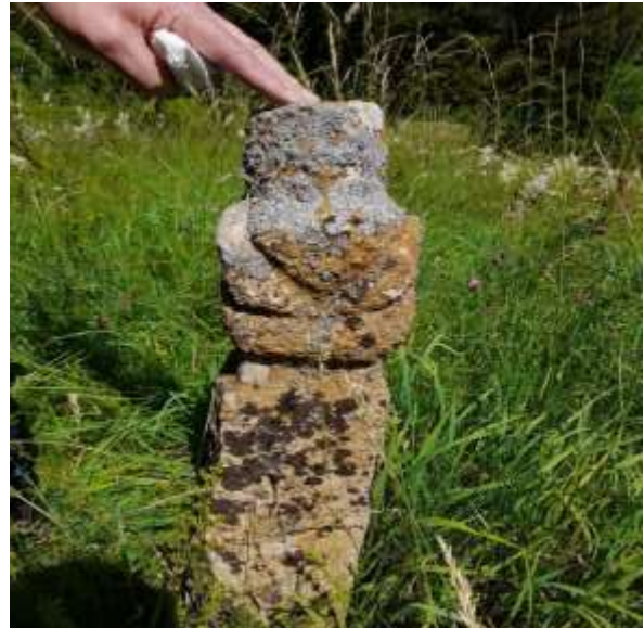
Slika 54. Muški nišan u Mižnovićima