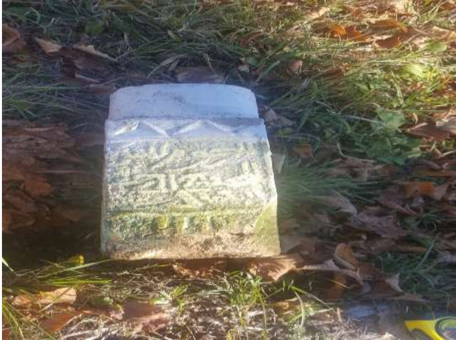
Slika 28. Oštećeni nišan bez turbana, na stanu s tarihom i godinom

Sljedeći nišan s prostora harema džamije u Karićima za analizu je s oštećenim turbanom, ali je na njemu primjetan tarih zajedno s godinom, i to 1195. prema hidžretskom računanju vremena, a 1783. prema gregorijanskom računanju vremena. Tekst na nišanu je nejasan na nekim dijelovima, ali na samom početku sa sigurnošću se može tvrditi da se spominje merhum. Ukupna visina nišana je 34 cm, a od toga visina vrata je 8 cm i stana 26 cm. Obim vrata iznosi 46 cm, dok je obim stana 13 cm.