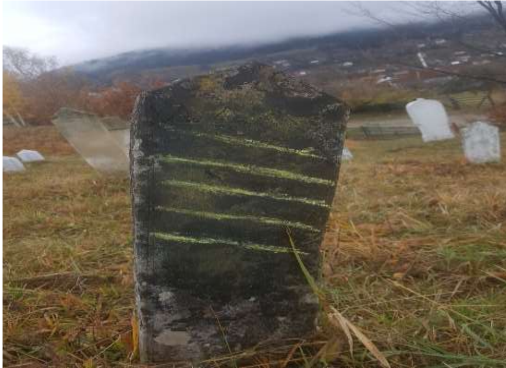
Slika 33. Ženski nišan, zadnja strana, Budoželje

Na prostoru Budoželja prepoznat je i nišan karakterističan po tome što su gužve nanizane uspravno, jedna pored druge. Ovo je nešto stariji nišan od ovih prethodnih iz sela Budoželja. U ranijem dijelu rada navedeno je kako su neki autori ovakvu vrstu nišana svrstavali u hadžijske. Ipak, to se ne može sa sigurnošću tvrditi jer ne postoje jasna obilježja koja bi išla u prilog toj činjenici. Na stani nišana nalazi se rozeta, dok na nišanu ne postoje bilo kakvi natpisi. Prema turbanu, rozeti i debljini nišana mogao bi se svrstati u drugu fazu izrade nišana. Visina nišana iznosi 60 cm, a od toga dužina turbana je 15 cm i 6 cm vrat nišana. Debljina stana iznosi u gornjem dijelu 15 cm, a u donjem 13 cm.