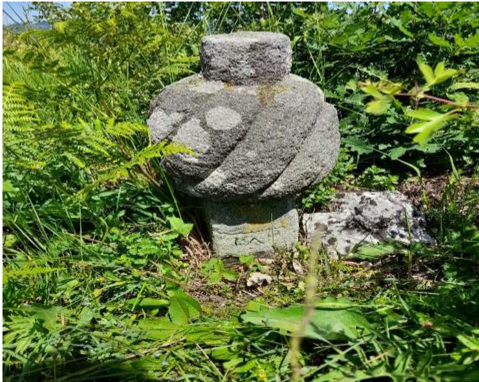
Slika 47. Esnafski nišan iz 1671. godine

Nišan koji zauzima prvo mjesto u analizi nišana s mezarja u Ligatićima jeste onaj iz 1671. godine. Na nišanu je upisana 1082., što bi shodno gregorijanskom kalendaru odgovaralo 1671. godini. Nišan se svrstava u esnafsku kategoriju i ujedno je jedan od najstarijih koji se nalazi na području ovog groblja. Izrađen je od zelenog tufa, a s obzirom da ovo područje ne obiluje ovim materijalom, vjerovatno je riječ o uvozu. Dimenzije ovog nišana nisu evidentirane jer je veći dio utonuo u zemlju.