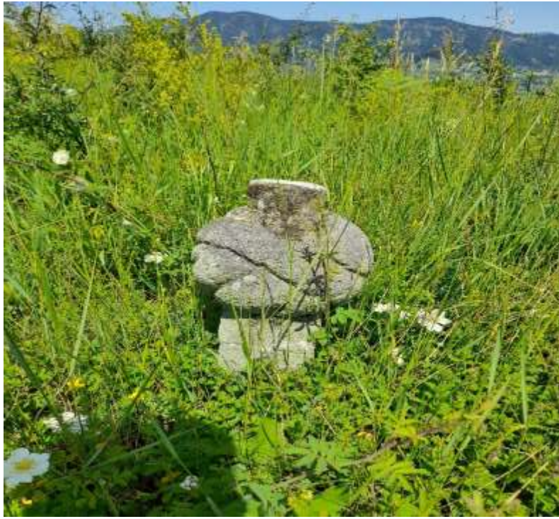
Slika 48. Ulemanski nišan s tugom bez natpisa

Posebno je upečatljiv i ulemanski nišan, karakterističan po svom poprečnom prevoju, a on vjerovato svjedoči o uglednoj osobi s ovog prostora.