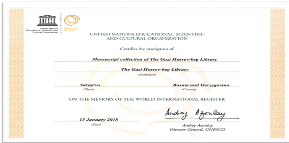
Slika br. 12 Šestoaprilska nagrada grada Sarajeva

dijelovima svijeta, naročito onom kojem prijeti uništenje i nestanak uslijed ratova i socijalnih nemira.