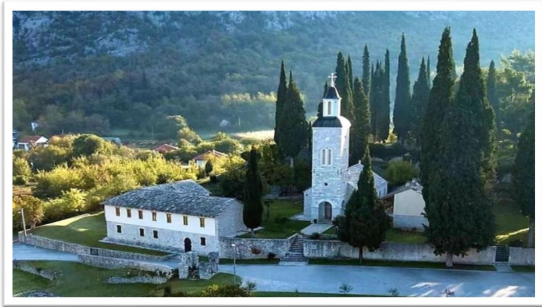
Slika br. 5 Manastir Žitomislić