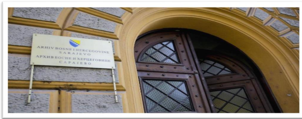
Slika br. 14 Arhiv Bosne i Hercegovine

Rad na fizičkom spašavanju mnoge arhivske građe i njenom preuzimanju u arhiv činio je s početka glavninu poslova Arhiva. U prvim godinama, Državni je arhiv za smještaj građe imao samo jednu prostoriju. Drugi osnovni problem u radu arhiva bio je stalni nedostatak kvalificiranog kadra. Takva situacija značajno je utjecala na rezultate Arhiva. 1956. godine započet je projekt Građa za proučavanje političkih, kulturnih i socijalno-ekonomskih odnosa iz prošlosti BiH (XIX i XX vijek), kao projekt stalne edicije kroz koju bi se objavljivala arhivska građa. Veoma brzo pokrenuto je i pitanje izdavanja stručnoga časopisa, pa je 1961. Arhiv sudjelovao i u pokretanju Glasnika arhiva i Društva arhivskih radnika, u socijalističkom periodu jedinog stručnog glasila u Bosni i Hercegovini. 1956. godine, također, Arhiv je sudjelovao i u organizaciji prve «Nedjelje arhiva», koja je održana od 16. do 30. septembra. Niz godina, ovo je bila najprikladnija manifestacija za širu akciju arhivske službe na kulturno-prosvjetnom planu.