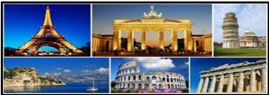
Slika 1. Kulturni turizam

Također, ljepša strana razvoja kulturnog turizma jeste novčani aspekt koji donosi dobro lokalnom mjestu, gradu ali i državi. Privlačenjem većeg broja turista donosi i bolje prihode, a samim tim i bolju reklamu za grad, i njegov dalji razvoj.