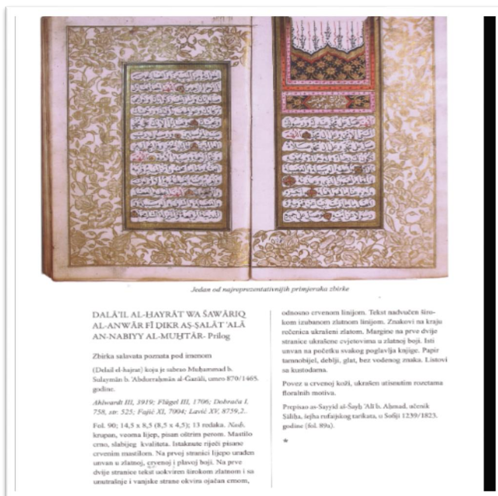
Slika br. 13 Zbirka salavata "Delail-el-hajrat"

U svojim digitalnim kolekcijama, posebno kolekcijama Stare periodike 36 i Specijalnim zbirka 37 , Nacionalna i univerzitetska biblioteka Bosne i Hercegovine baštini, čuva, te daje na korištenje bogato kulturno-umjetničko višestoljetno naslijeđe Bosne i Hercegovine, a neki od njenih eksponata (Zbirka salavata "Delail-el-hajrat" iz 1823. godine, "Die Großen Französischen Impressionisten"), nalazili su se u Kući evropske historije čije je sjedište u Briselu. "Die Großen Französischen Impressionisten - Veliki francuski impresionisti, autora Fritz Novotny, objavljena je 1952. godine u Beču. Radi se o knjizi koja je spašena iz vatrene stihije 1992. godine u Vijećnici, jer se vide ugljenisani tragovi. Trenutno se u Kući evropske historije nalazi publikacija "Das grosse Bruegel-Werk", autora Gustava Glücka, izdanje iz 1955. godine (štampano u Beču i Minhenu koja sadrži 124 stranice).