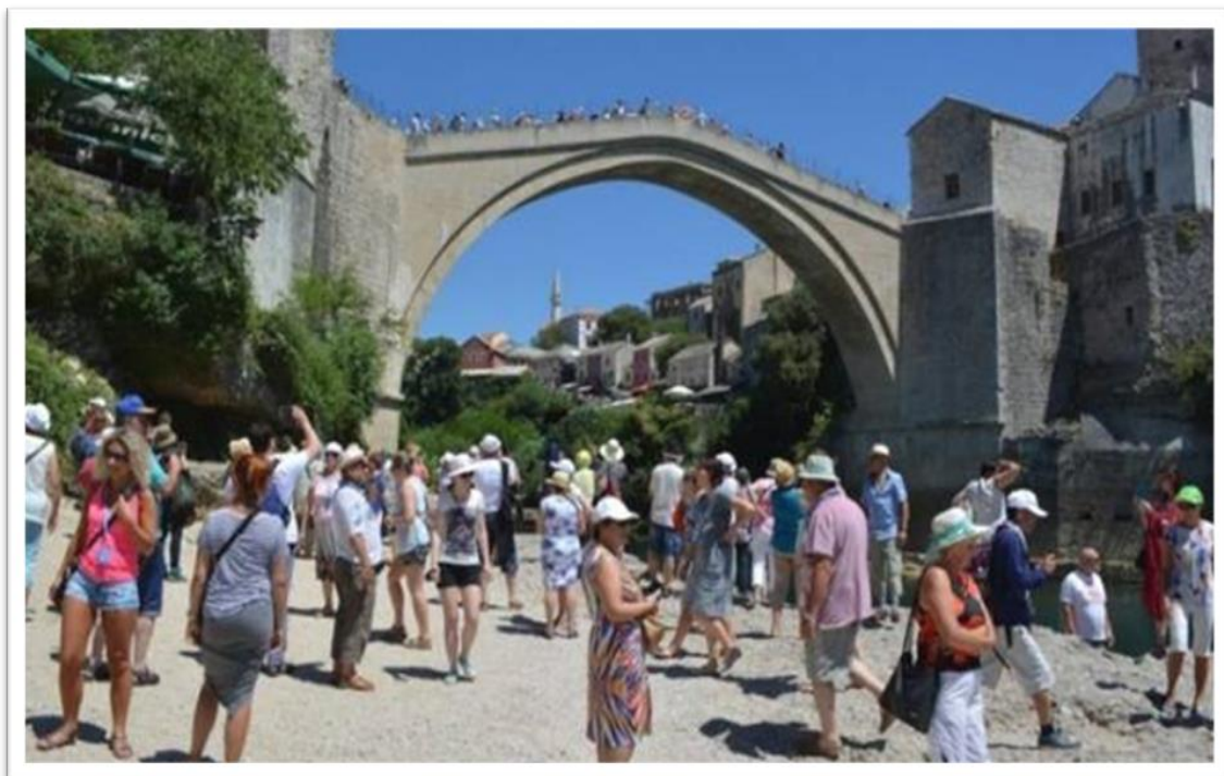
Slika br. 2 Stari Most, Mostar

Dakle, upisana dobra iz Bosne i Hercegovine na UNESCO-ovoj Listi svjetske baštine su most Mehmed-paše Sokolovića u Višegradu i područje Starog mosta starog grada Mostara, kao i stećci - srednjovjekovni nadgrobnici (18.4.2011) i Stari Most u Mostaru.