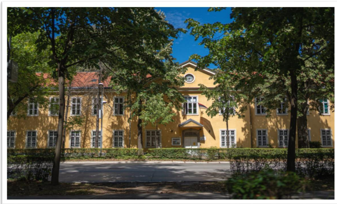
Slika br. 16 Zgrada Arhiva RS

Razorni zemljotres, koji je 27. oktobra 1969. godine pogodio Banjaluku, neminovno je ostavio posljedice i na razvoj arhivske službe. Tek sredinom 1973. godine pronašlo se polovično rješenje smještajnih problema Arhiva. Zajedno sa Muzejom Bosanske Krajine, Arhiv useljava u djelimično saniranu „Carsku kuću“, vojni objekat sagrađen prvim godinama austrougarske okupacije, 1880. godine. JNA, čija je Komanda banjalučkog garnizona do tada bila smještena u toj zgradi, preseljava se u nove, namjenske objekte u neposrednoj blizini – Komandu garnizona i Dom vojske.