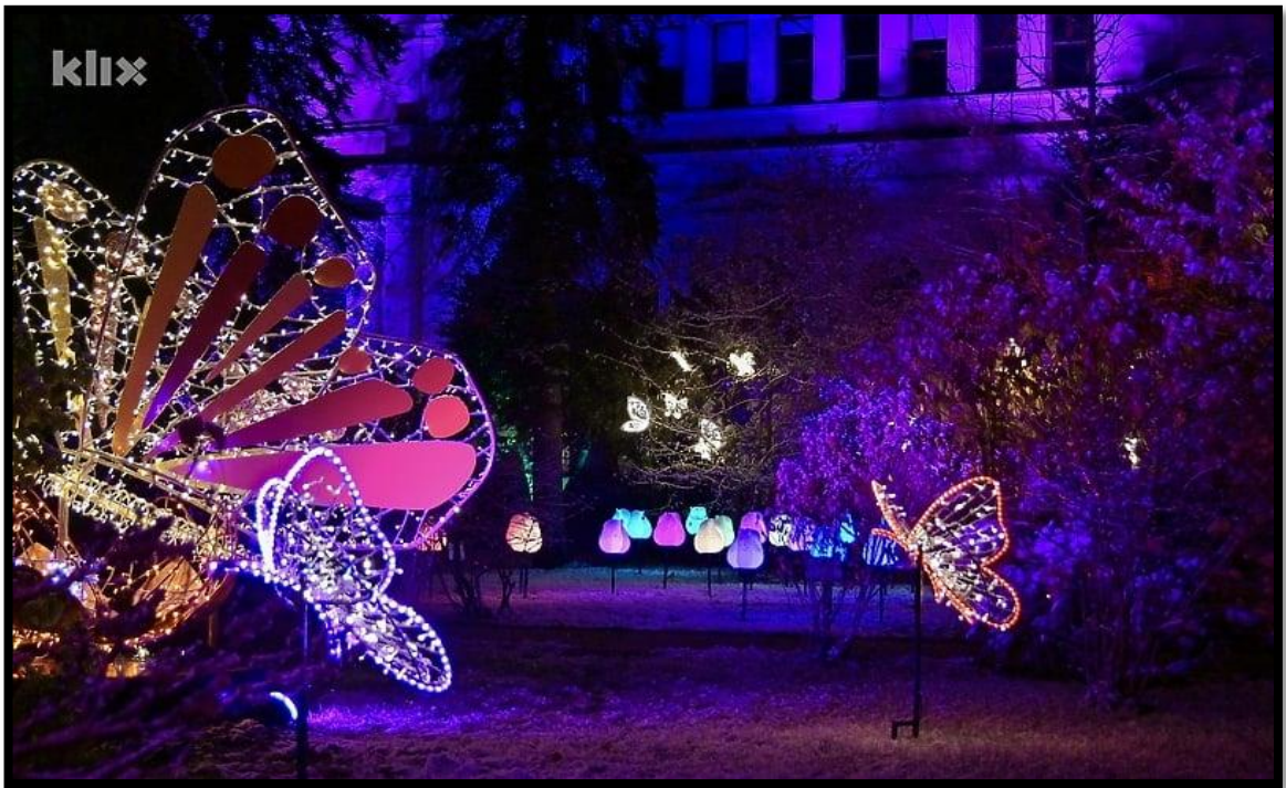
Slika br. 9 Festival svjetla u Zemaljskom muzeju Bosne i Hercegovine

ovaj projekat veliko osvježenje u Sarajevu, te prilika da se muzej posjeti i pokaže u noćnom izdanju, a ujedno i veliki plus sa saradnju muzeja te njegovu promociju.