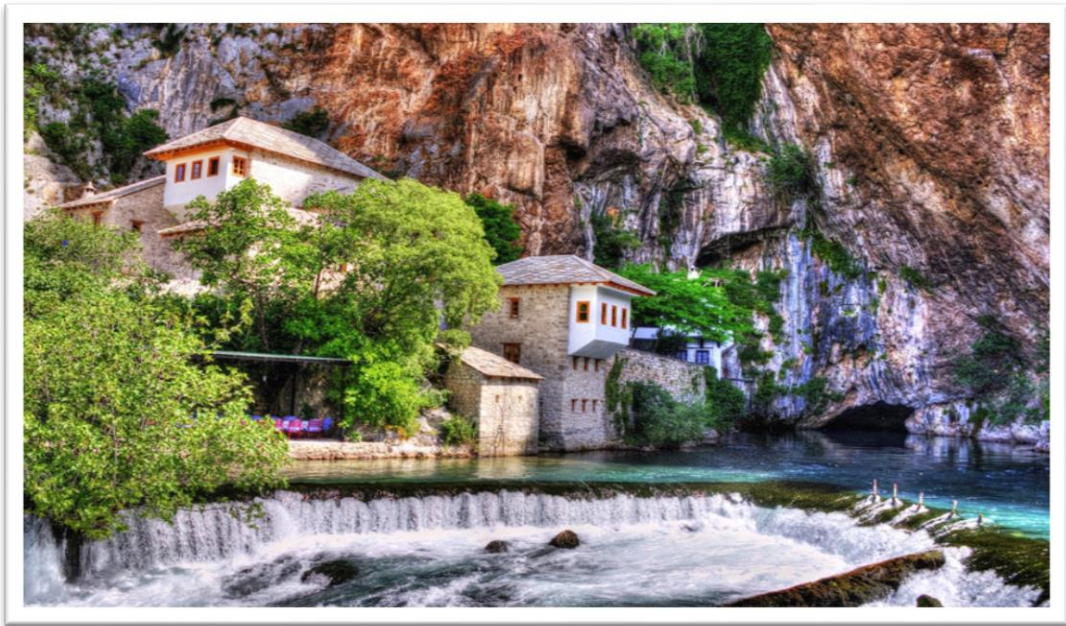
Slika br. 3 Tekija, Blagaj