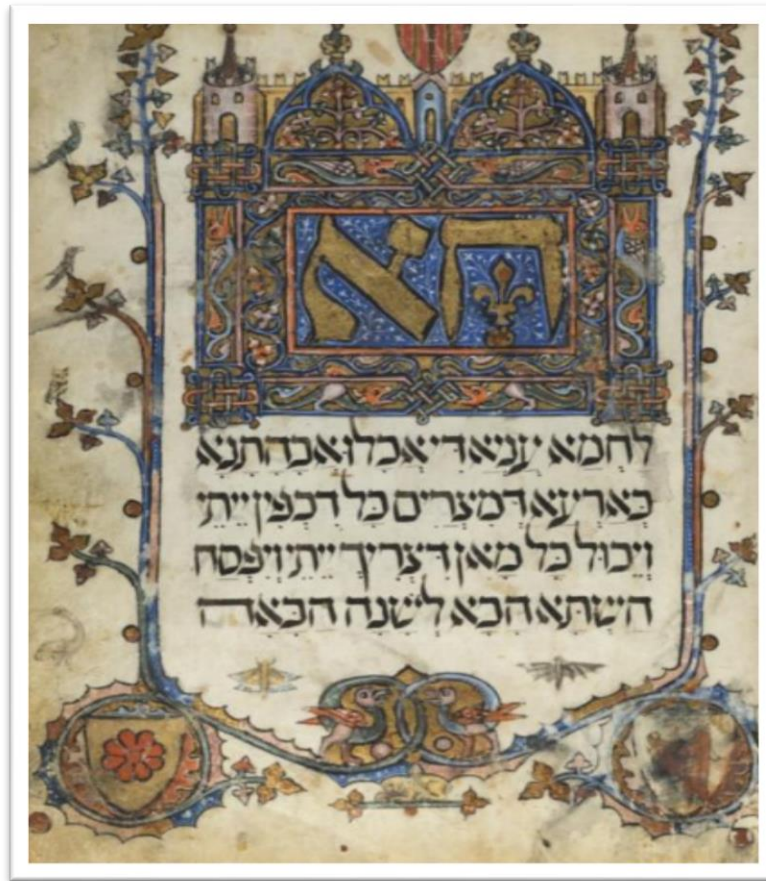
Slika br. 8 Sarajevska hagada

Naredni dio zauzimaju predmeti koje je moguće vidjeti u 3d rezoluciji. Neki od njih su Stećak Vlatka Vlađevića iz srednjeg vijeka ili Zgoščanski sljemenak također iz srednjeg vijeka. Ono što je danas veoma važno jeste biti u koraku s tehnologijom, a Facebook stranica muzeja ispunjena je svakodnevnim objavama i dešavanjima, što omogućava uvid svim korisnicima u rad samog muzeja. Muzej ove godine obilježava 135. godišnjicu i tim povodom 1. februara organizovani su dani otvorenih vrata, te je omogućen uvid u depoe u kojima se čuva višestoljetni knjižni fond. 29 Bitno je napomenuti da omogućavaju i besplatan ulaz, na primjer povodom Dana žena, što bude objavljeno i u dnevnim novinama kako bi što više ljudi imalo priliku da vidi jedinstvene izložbene primjerce.