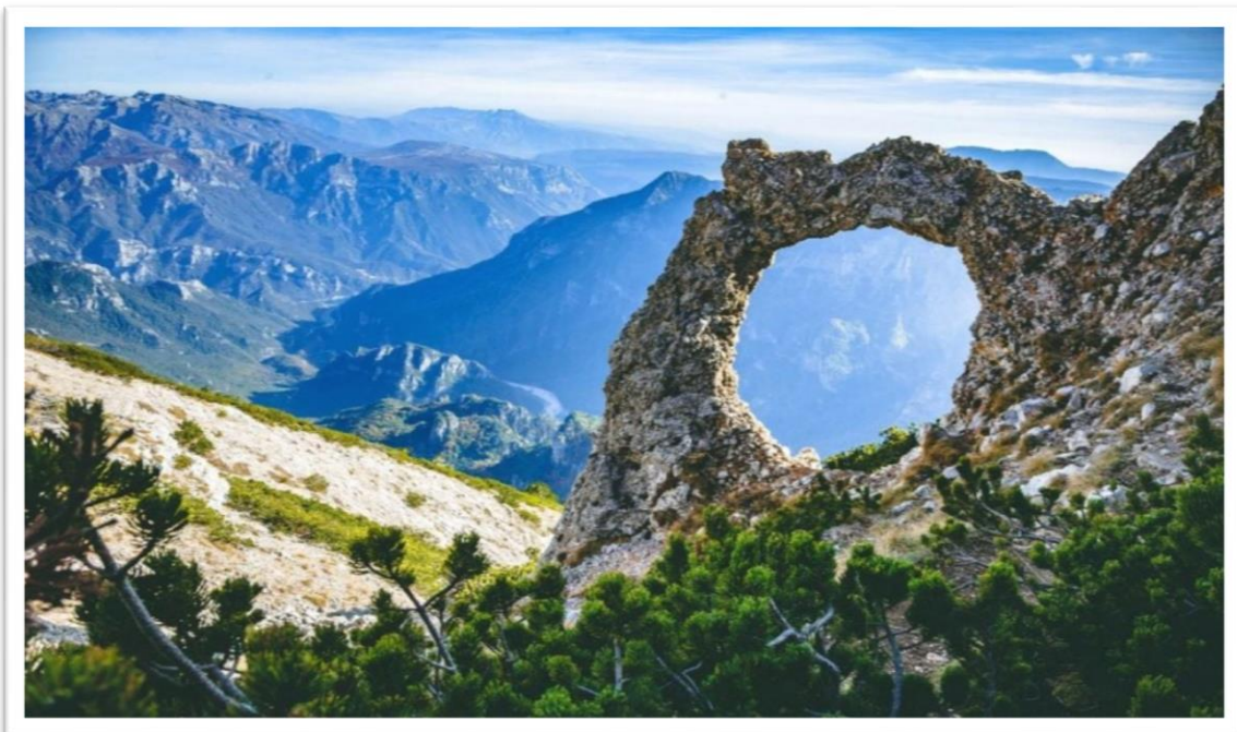
Slika br. 4 Park prirode Blidinje