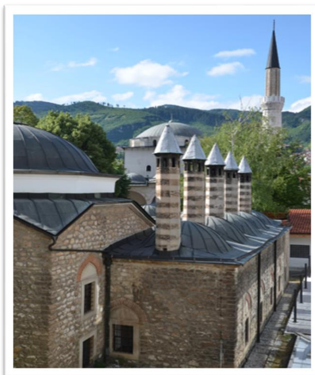
Slika br. 11 Gazi Husev-begova biblioteka

Gazi Husrev-begova biblioteka danas ima oko stotinu hiljada bibliotečkih jedinica, među kojima je preko 10.500 rukopisnih kodeksa na arapskom, turskom, perzijskom i bosanskom jeziku, između devet i deset hiljada pojedinačnih dokumenata na osmanskome jeziku, oko 21.000 štampanih knjiga na orijentalnim i preko 30.000 na evropskim jezicima, kao i bogat fond periodike od kraja 19. stoljeća do najnovijih časopisa koji se objavljuju kod nas i u svijetu. Biblioteka posjeduje i vrijednu muzejsku zbirku, fototeku i zbirku poštanskih maraka. 32