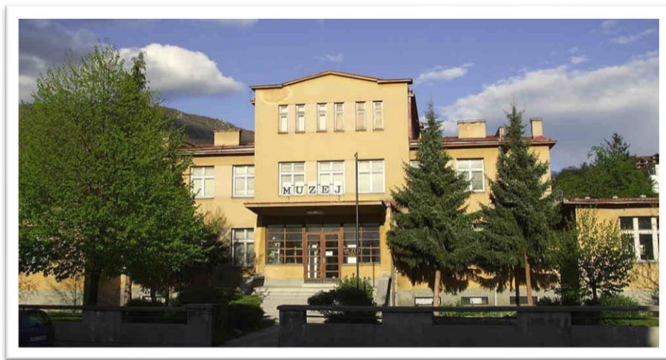
Slika br. 10 Zavičajni muzej Travnik

Raznovrsnost zbirki i mnoštvo eksponata čine ga neizostavnim mjestom za upoznavanje prošlosti i prirodne baštine travničkog kraja. Stalna izložbena postavka, kao i tematske izložbe, predstavljaju istinsku atrakciju za domaće i inostrane turiste, školske ekskurzije i druge zaljubljenike u tradicionalnu kulturu i običaje svih ljudi i naroda koji od prahistorije naseljavaju ovaj dio BiH. 30