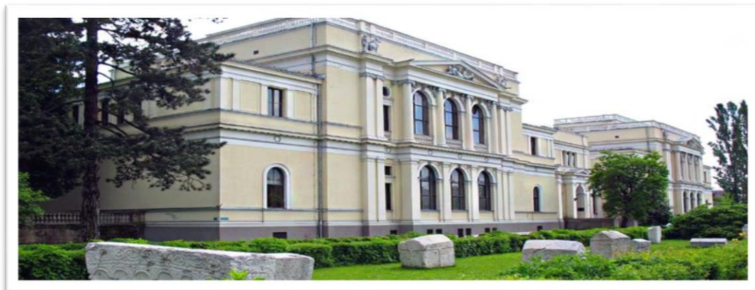
Slika br. 7 Zgrada Zemaljskog muzeja u Sarajevu

Obzirom da je u današnje vrijeme napredak tehnologije vidljiv na svim područjima, a cilj ovakvih ustanova jeste prilagoditi se novim izazovima, stoga je bitno obratiti pažnju na Internet stranicu samog muzeja, kao i događaje kojima se trude privući posjetioce.