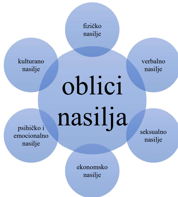
Shema 1. Oblici nasilja prema Bilić (2003).

Kada je riječ o fizičkom nasilju najčešći primjer takvog vida nasilja jeste udaranje ili nanošenje tjelesnih povreda. Fizičko kažnjavanje nerijetko može preći u fizičko nasilje. Fizičko nasilje je u ranijim periodima bilo prisutno u procesu odgajanja djece, te se smatralo čak i prihvatljivim sredstvom da bi dijete usmjeravalo ka poželjnim oblicima ponašanja, međutim mnogi istraživači smatraju da takvo sredstvo nije adekvatno i da ima kratkoročni učinak, te se zbog toga u savremenom dobu zabranjuje fizičkog kažnjavanja djeteta. Fizičko kažnjavanje se zabranjuje zbog toga što ostavlja dugoročne štetne posljedice na dijete i njegov cjelokupni razvoj. Iako je najočitiiji, nije jedini oblik nasilja jer postoje i drugi oblici nasilja, koji se možda ne mogu primijetiti golim okom, a koji se odražavaju na pojedinca podjednako negativno i surovo.