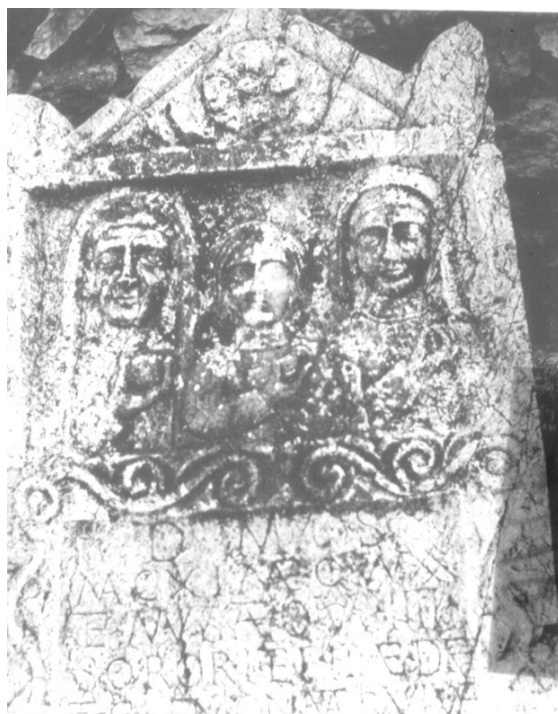
Slika 3. Nadgrobnna stela sa prikazom dječijeg porsja iz Kolovrata.