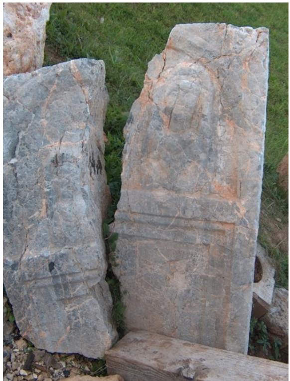
Slika 4a. Nadgrobna stela iz Komina – izgled i stanje spomenika pola stoljeća kasnije.