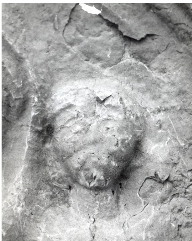
Slika 5a. Detalj reljefne predstave na nadgrobnom spomeniku Valerijana iz Municipija S....