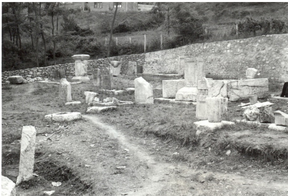
Slika 2. Nekropola u Kolovratu kod Prijepolja (Fotodokumentacija Arheološke zbirke Filozofskog fakulteta u Beogradu).