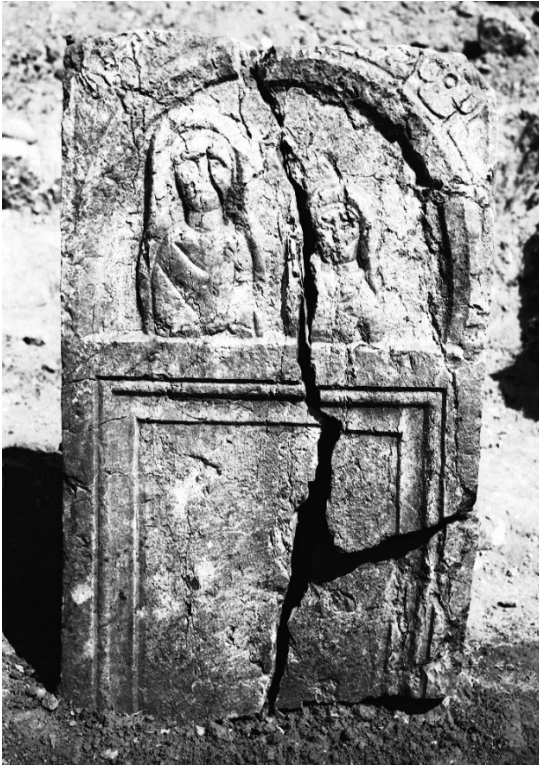
Slika 4. Nadgrobna stela iz Komina po iskopavanju (Fotodokumentacija Zavičajnog muzeja u Pljevljima i Arheološke zbirke Filozofskog fakulteta u Beogradu).