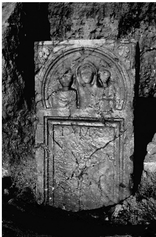
Slika 5. Nadgrobnji spomenik Valerijana iz Municipijuma S... (Komini kod Pljevalja), (Fotodokumentacija Zavičajnog muzeja u Pljevljima i Arheološke zbirke Filozofskog fakulteta u Beogradu).